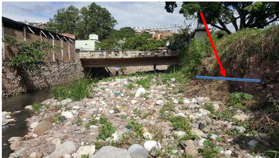
Construcción muro de contención: altura= 3.00 m.