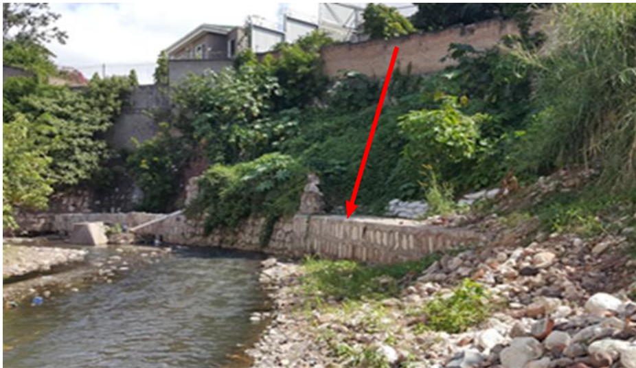
Tramo de muro por finalizar: L= 68.00 m; H= 3.00 m; A= 1.70 m.

Proyecto: Construcción de muro de contención (II etapa), colonia Las Colinas Código: 949