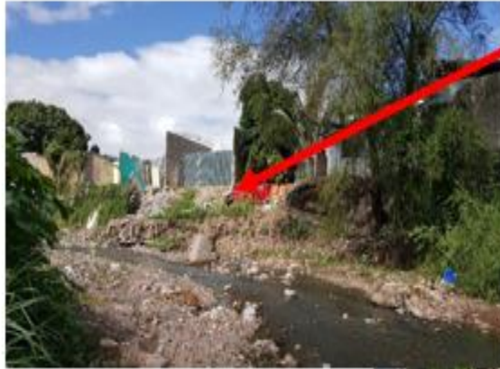
Construcción de Muro de Mampostería Long.: 41 m. H.:5.00 m, Base: 2.50 m.

Proyecto: Construcción de muro de contención (II etapa), colonia Las Colinas Código: 949