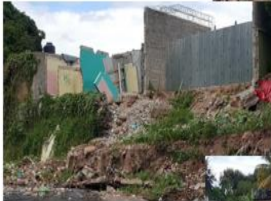
Condiciones actuales donde se construirá Muro de Mampostería Long.: 41 m. H.:5.00 m, Base: 2.50 m.