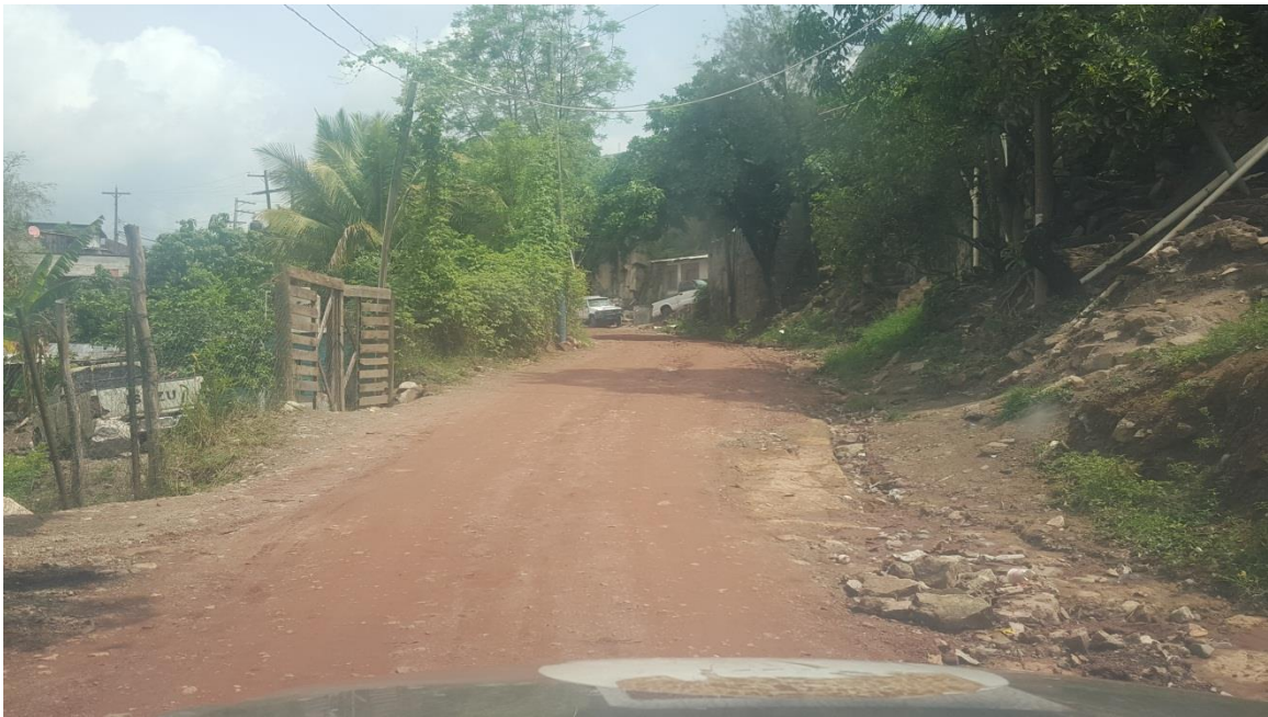
Vista de calle a pavimentar