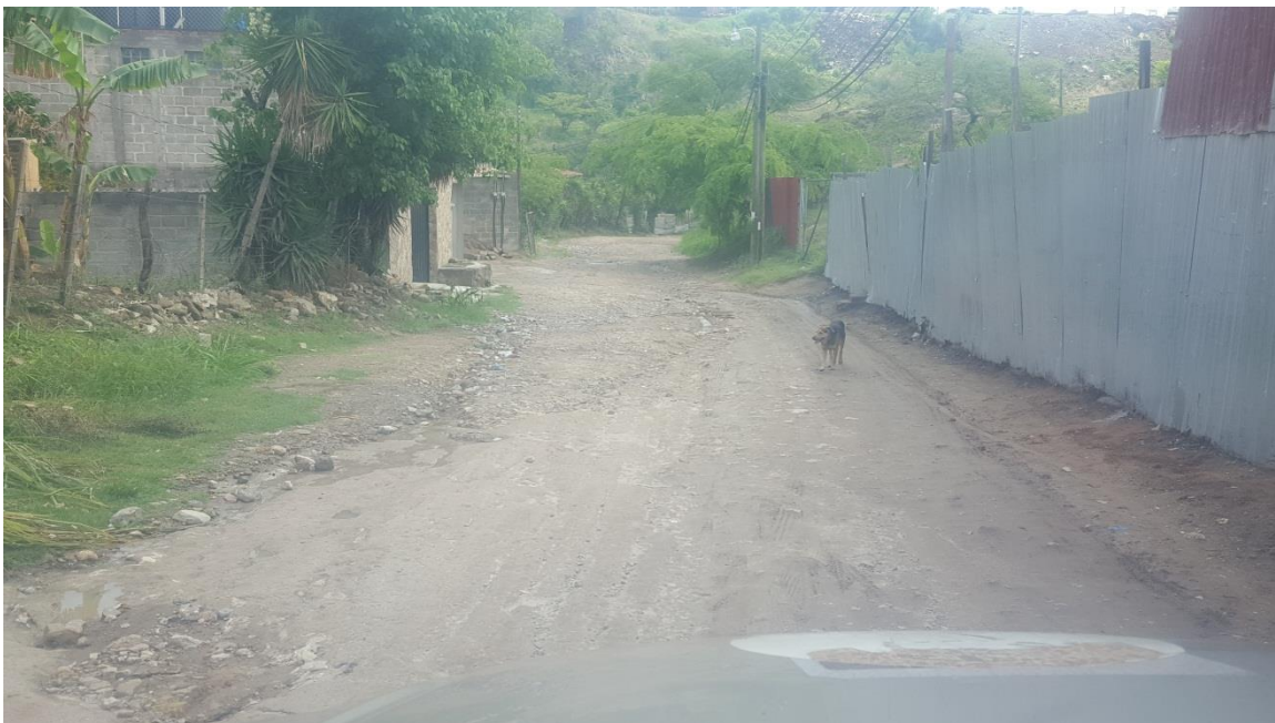
Inicio de la calle a pavimentar