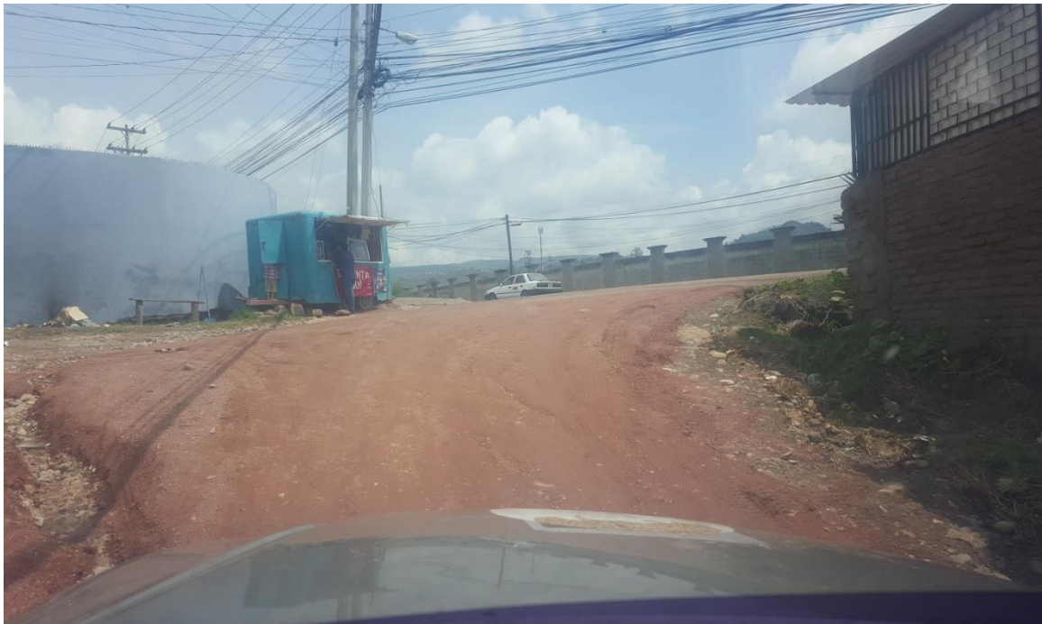
Fin de calle a pavimentar