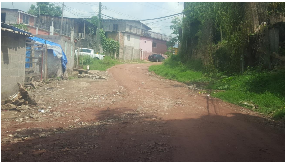
Vista panorámica de la calle