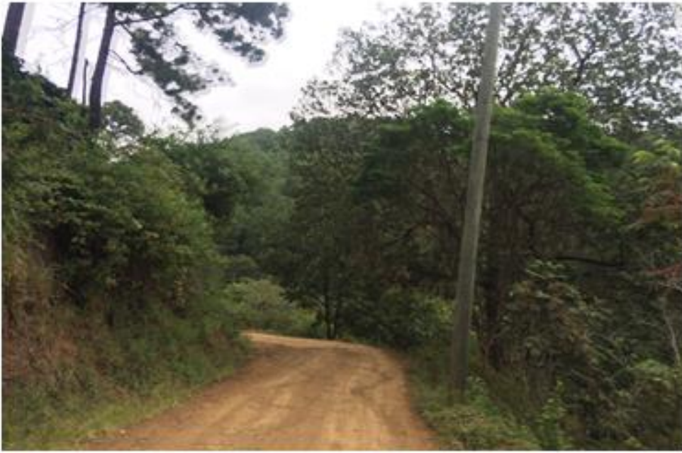
INICIO DE CALLE A REPARAR