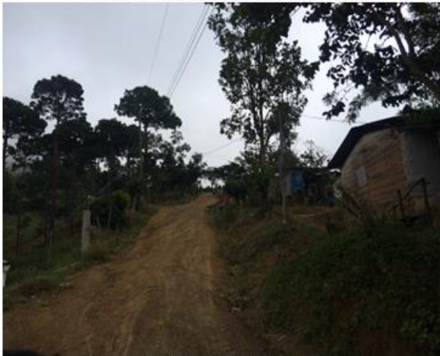
VISTA DE CALLE QUE REQUIERE BALASTADO