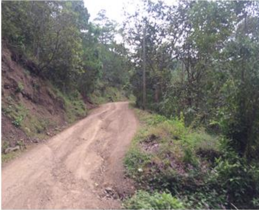
VISTA PANORÁMICA DE CALLE A REPARAR