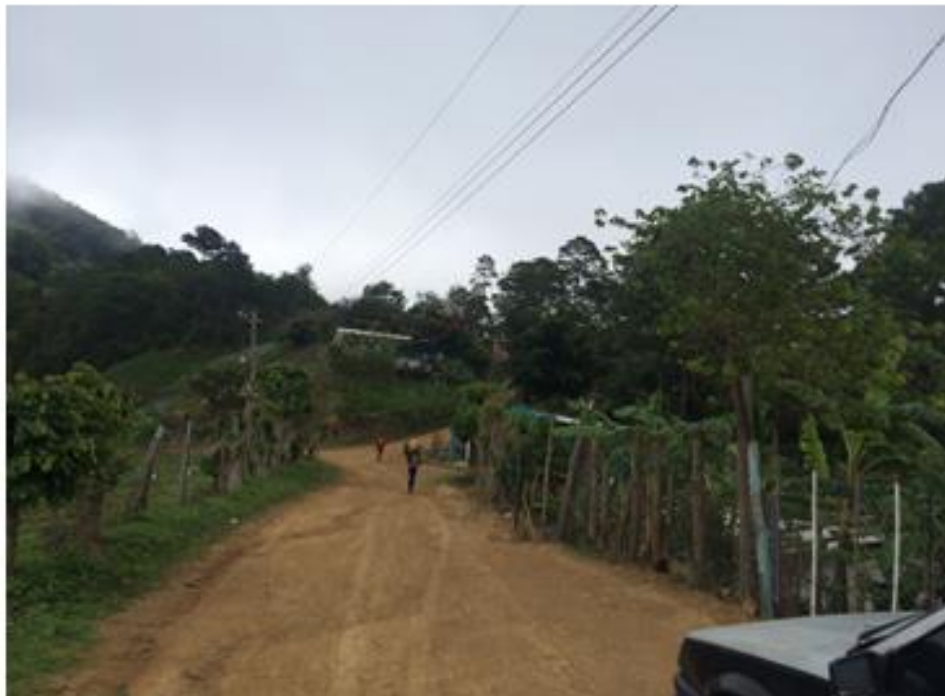
VISTA ACTUAL DE CALLE A REPARAR