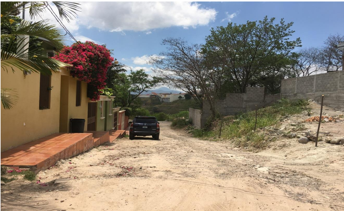
Vista panorámica de la calle