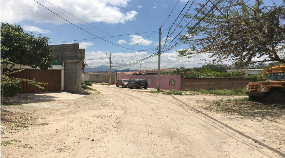
Inicio de la calle a pavimentar