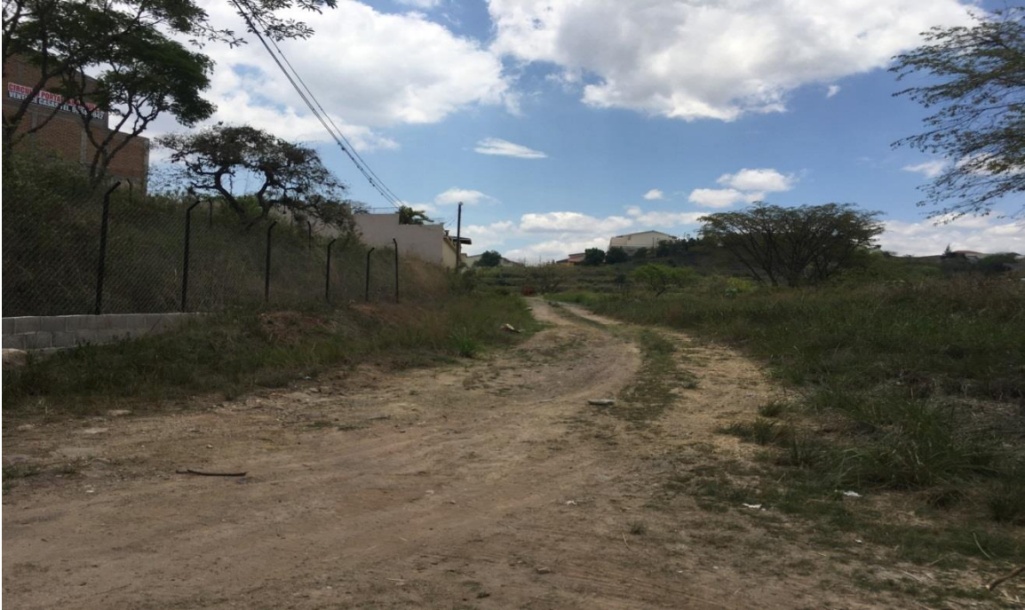
Vista de la calle