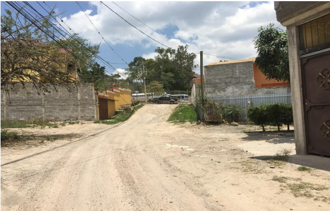
Fin de calle a pavimentar