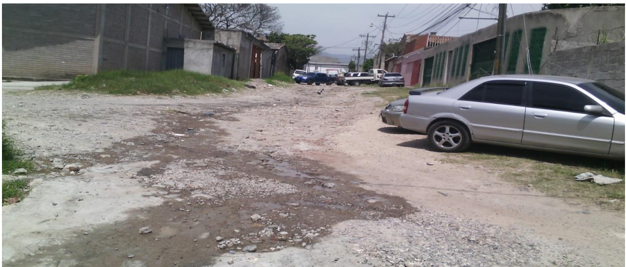
Vista panorámica de la calle