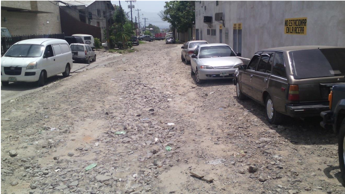
Vista de la calle

Proyecto: Pavimentación de calle con concreto hidráulico, col. Santa Bárbara, calle principal Código: 936