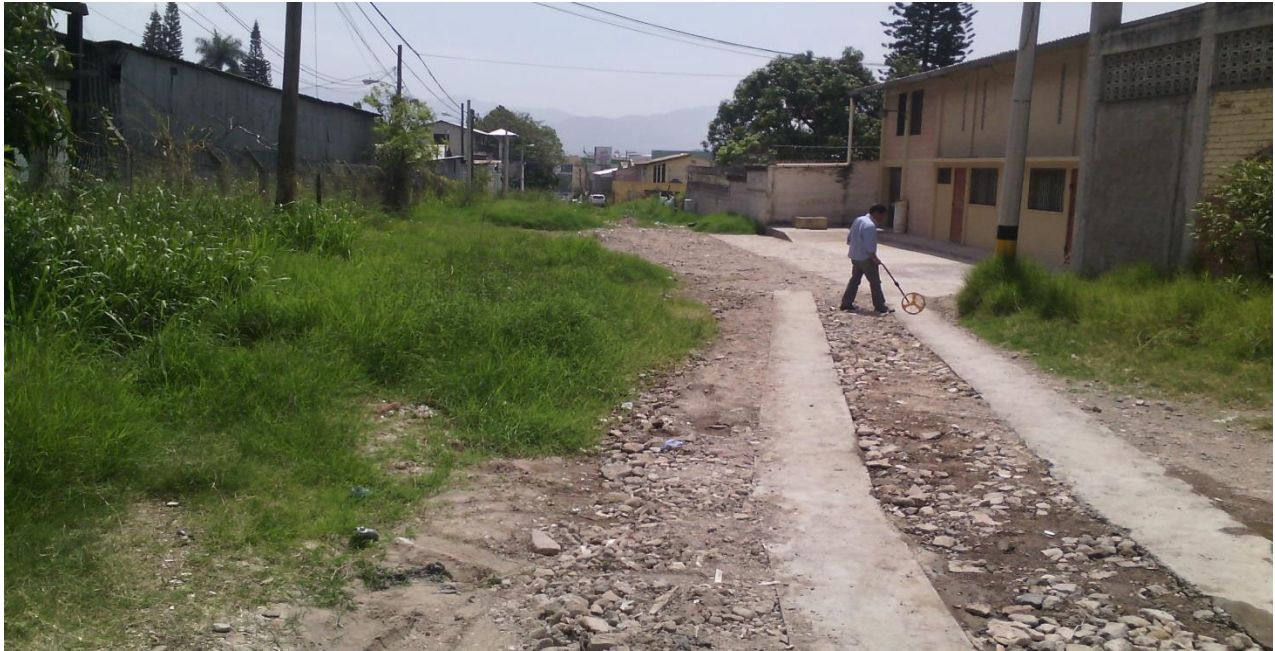
Inicio de calle a pavimentar