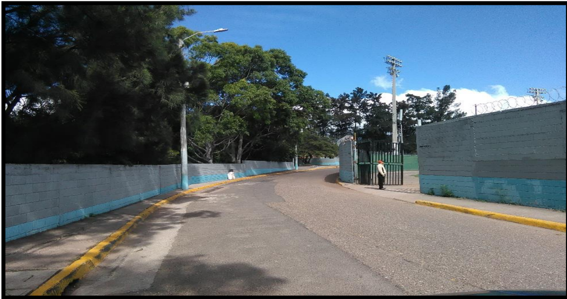
CIRCUITO INTERNO DE VILLA OLÍMPICA.