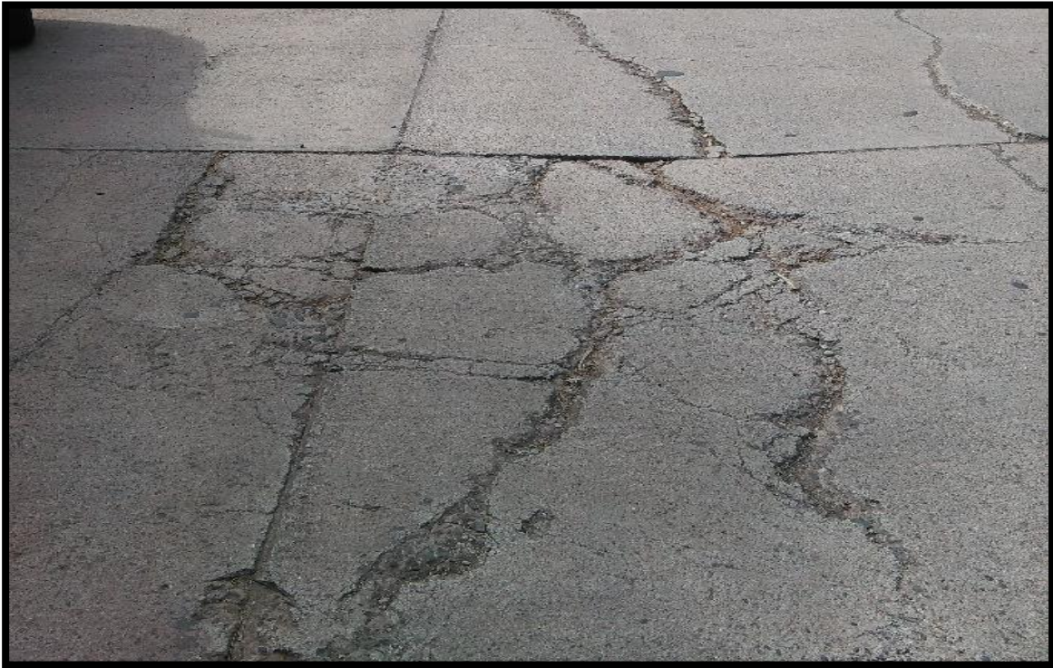
VISTA DE LAS FRACTURAS EN LOSAS DE CONCRETO HIDRÁULICO EXISTENTE.