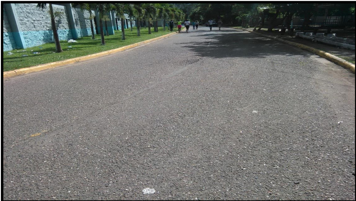
VISTA DEL DESGASTE EN LA CARPETA ASFÁLTICA EXISTENTE.