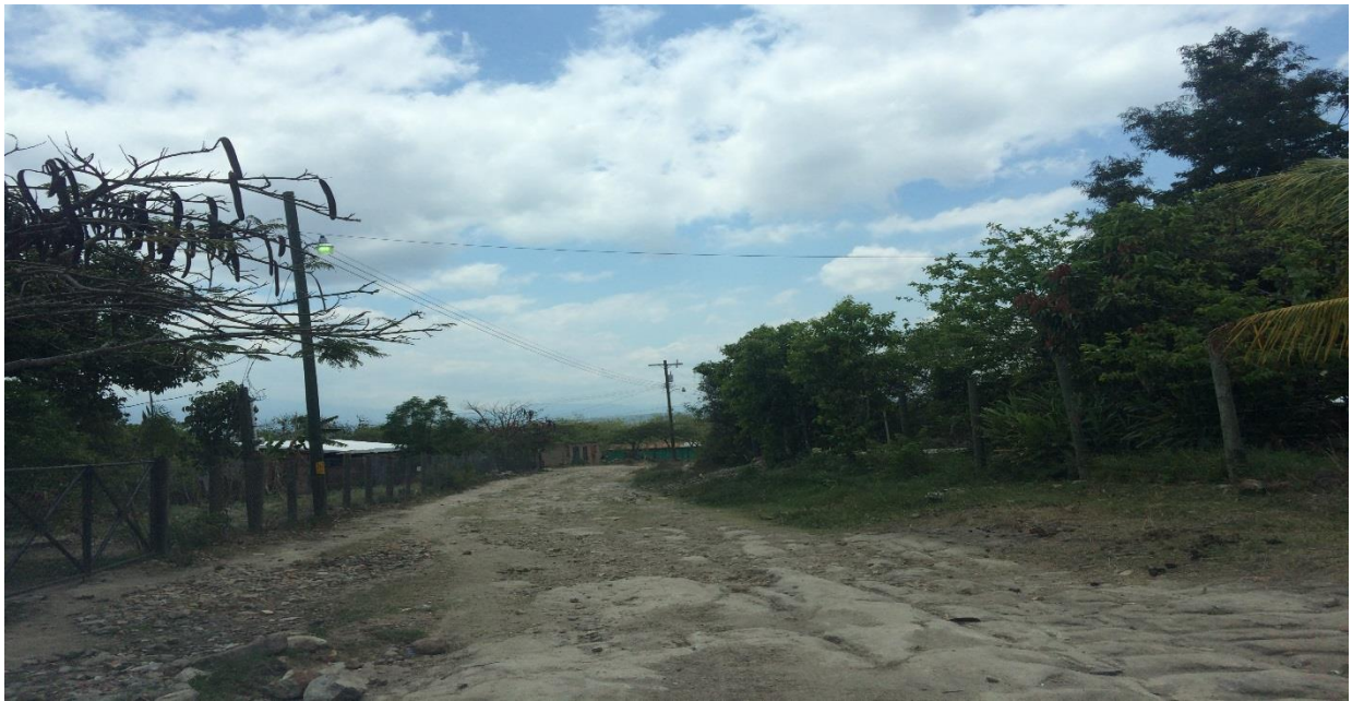
Vista de la Calle