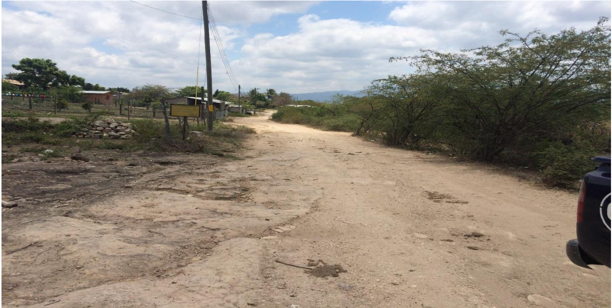
Calle a Balastar