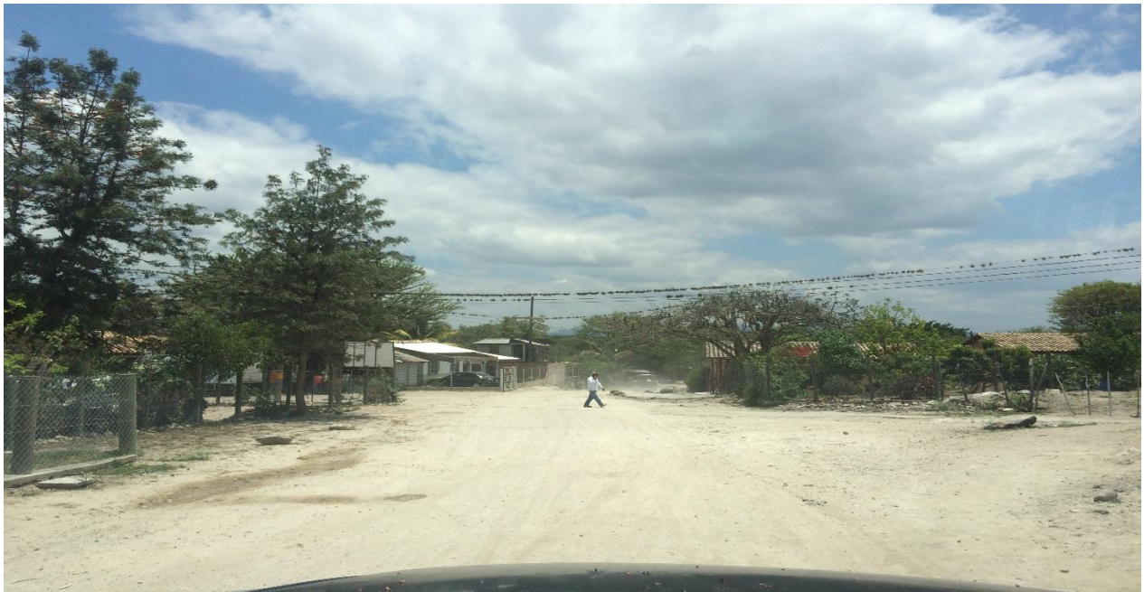
Fin de Calle a Balastar