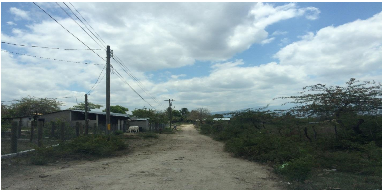
Vista Panorámica de la Calle