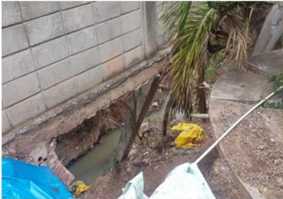
SECCIÓN DE MURO COLAPSADO TRAMO "C"