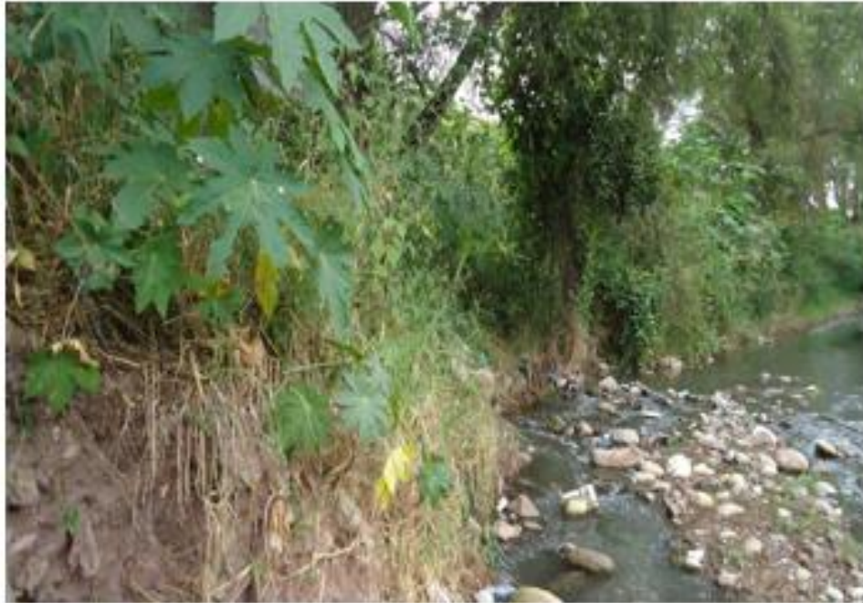
VISTA DE MARGEN DE LA QUEBRADA DONDE SE CONSTRUIRÁ EL MURO "B"

Proyecto: Construcción de muro de contención en col. Las Colinas, frente a Universidad Pedagógica Código: 1670