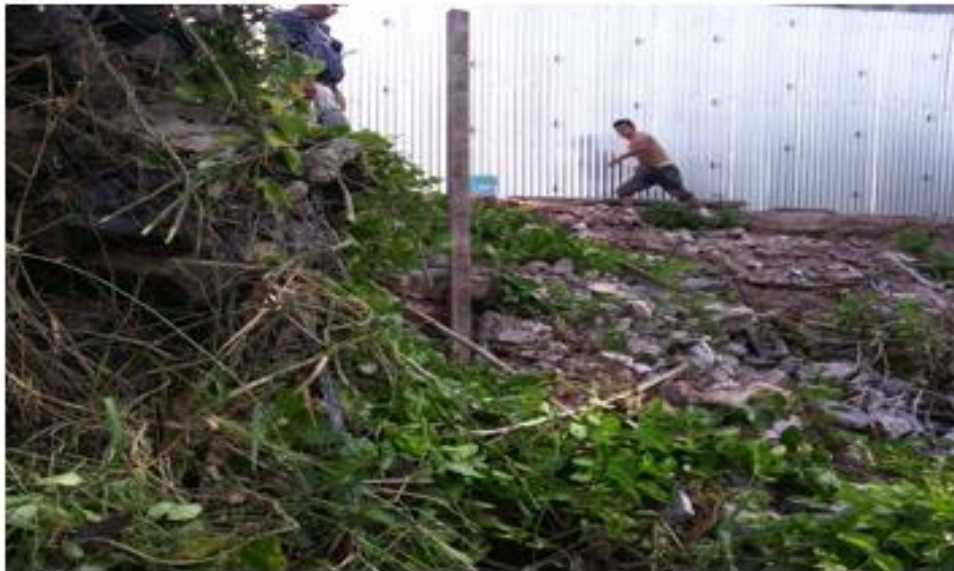
VISTA LATERAL DEL TERRENO DONDE SE CONSTRUIRA MURO "A"