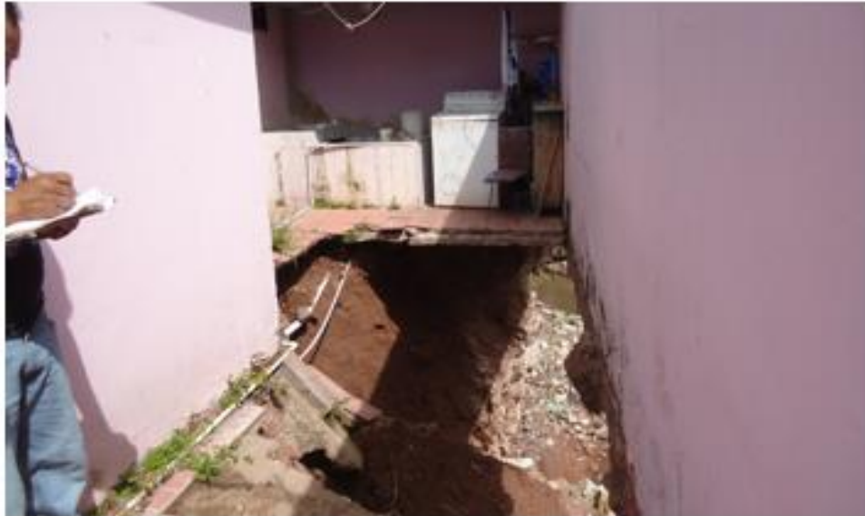
VISTA DE LOS DAÑOS EN LOS CIMENTOS DEL MURO DE LA SECCIÓN "A"

Proyecto: Construcción de muro de contención en col. Las Colinas, frente a Universidad Pedagógica Código: 1670