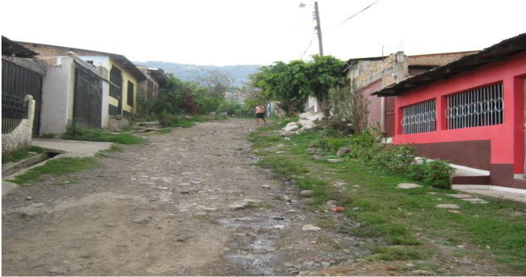
Calle a Balastar