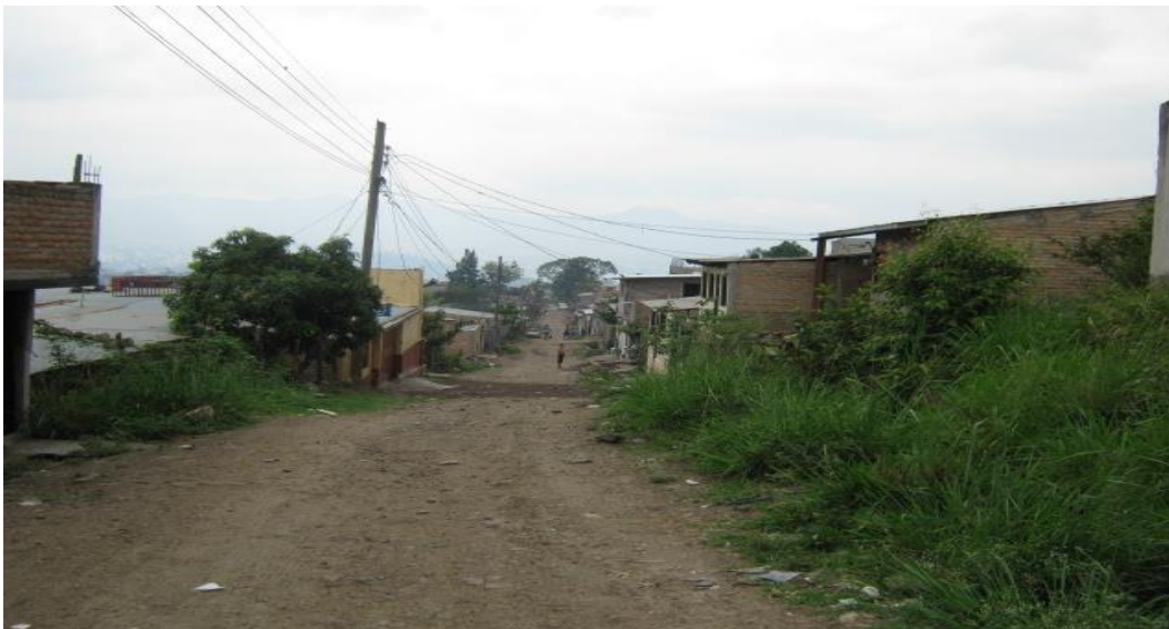
Vista Panorámica de la Calle