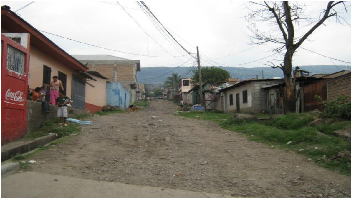
Vista de la Calle