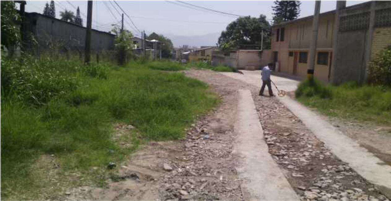
Inicio de calle a pavimentar

Col. Santa Bárbara, calle principal, desvío en La calle de Los Alcaldes, frente a Diario La Tribuna, en Comayagüela M.D.C