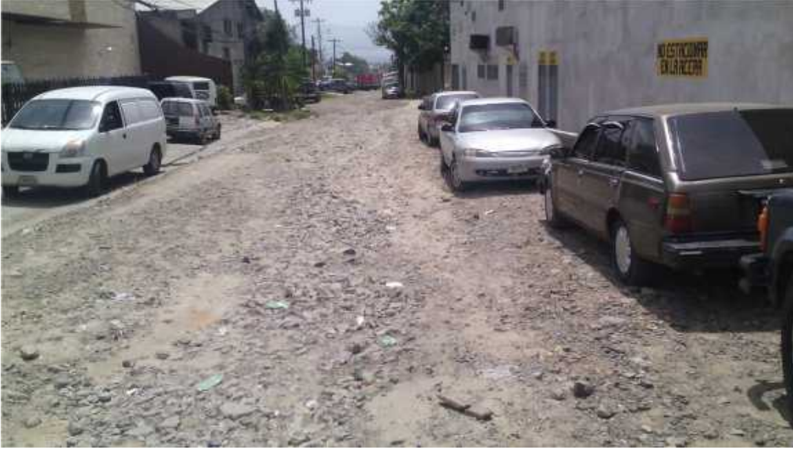
Vista de la calle