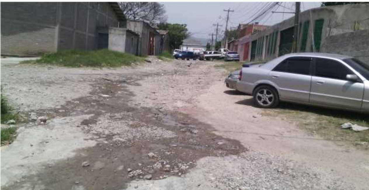
Vista panoramica de la calle