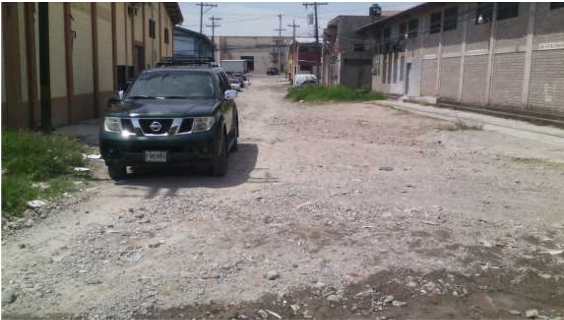
Fin de calle a pavimentar