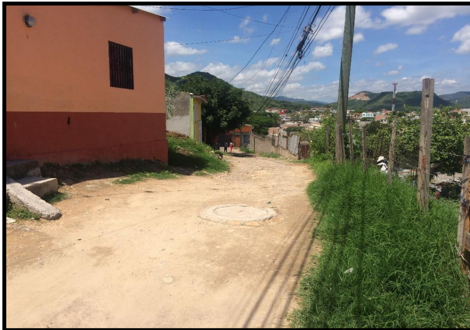
VISTA DEL TRAMO A PAVIMENTAR