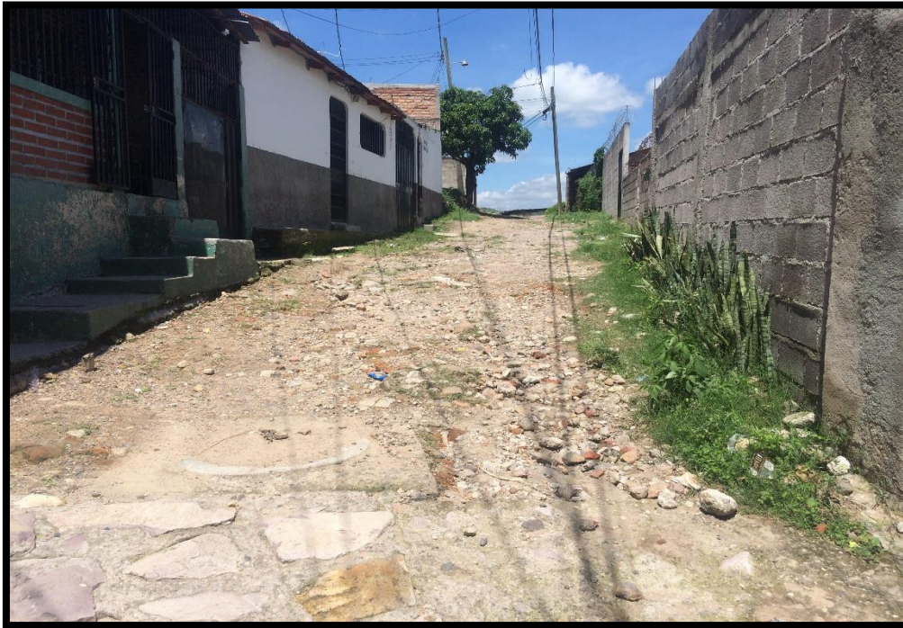
VISTA DEL MAL ESTADO DE LAS CALLES