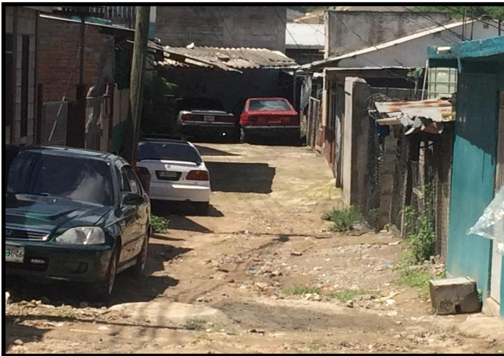
TRAMO FINAL DE LA PAVIMENTACIÓN