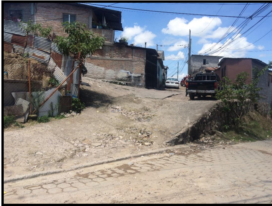
VISTA DEL INICIO DE LA CALLE A PAVIMENTAR