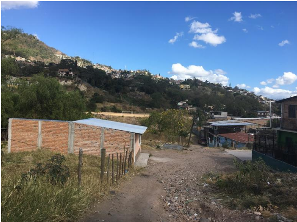
FINAL DE CALLE A PAVIMENTAR CON CONCRETO HIDRÁULICO