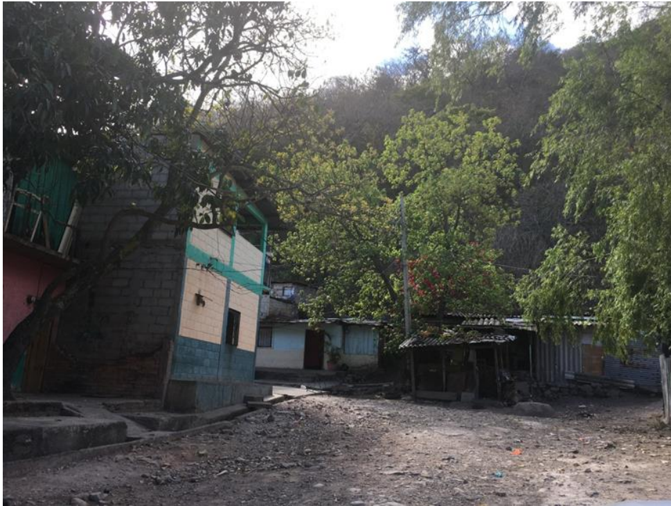
PANORAMA DE LA CALLE A PAVIMENTAR

Proyecto: Pavimentación de calle con concreto hidráulico, barrio El Chile, calle final Código: 1663