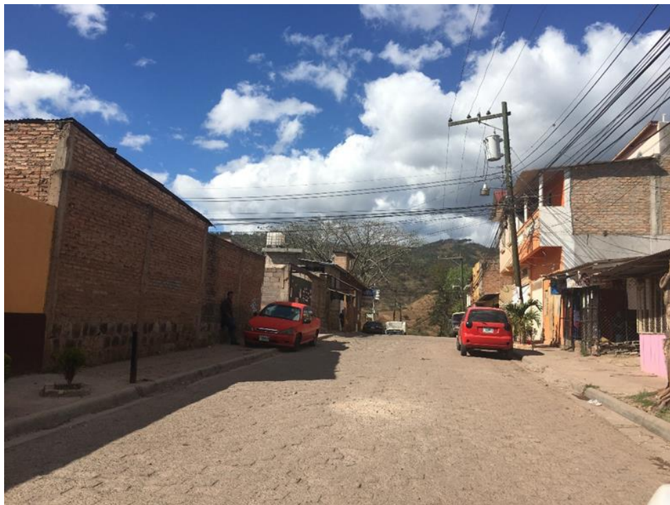
FINAL DE CALLE A PAVIMENTAR CON CONCRETO HIDRAULICO