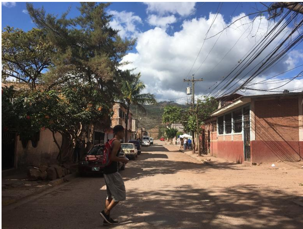
VISTA DE LA CALLE A PAVIMENTAR CON CONCRETO HIDRÁULICO