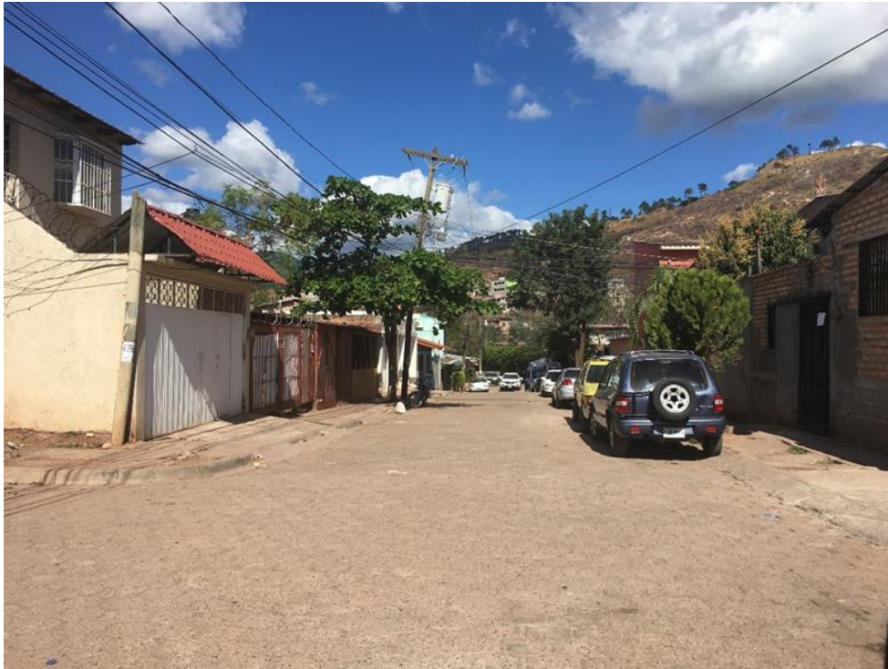
VISTA DE LA CALLE DONDE SE DESMONTARÁ EL ADOQUÍN