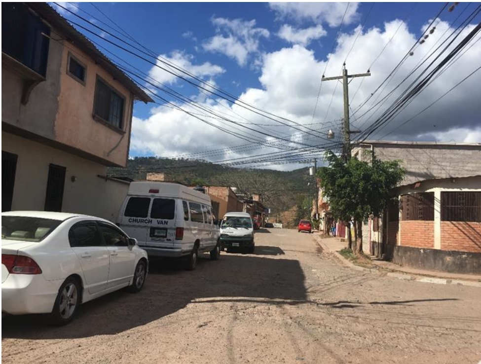
PANORAMA DE LA CALLE A PAVIMENTAR