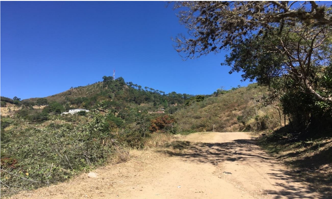
PANORAMA DE LA CALLE EN MAL ESTADO