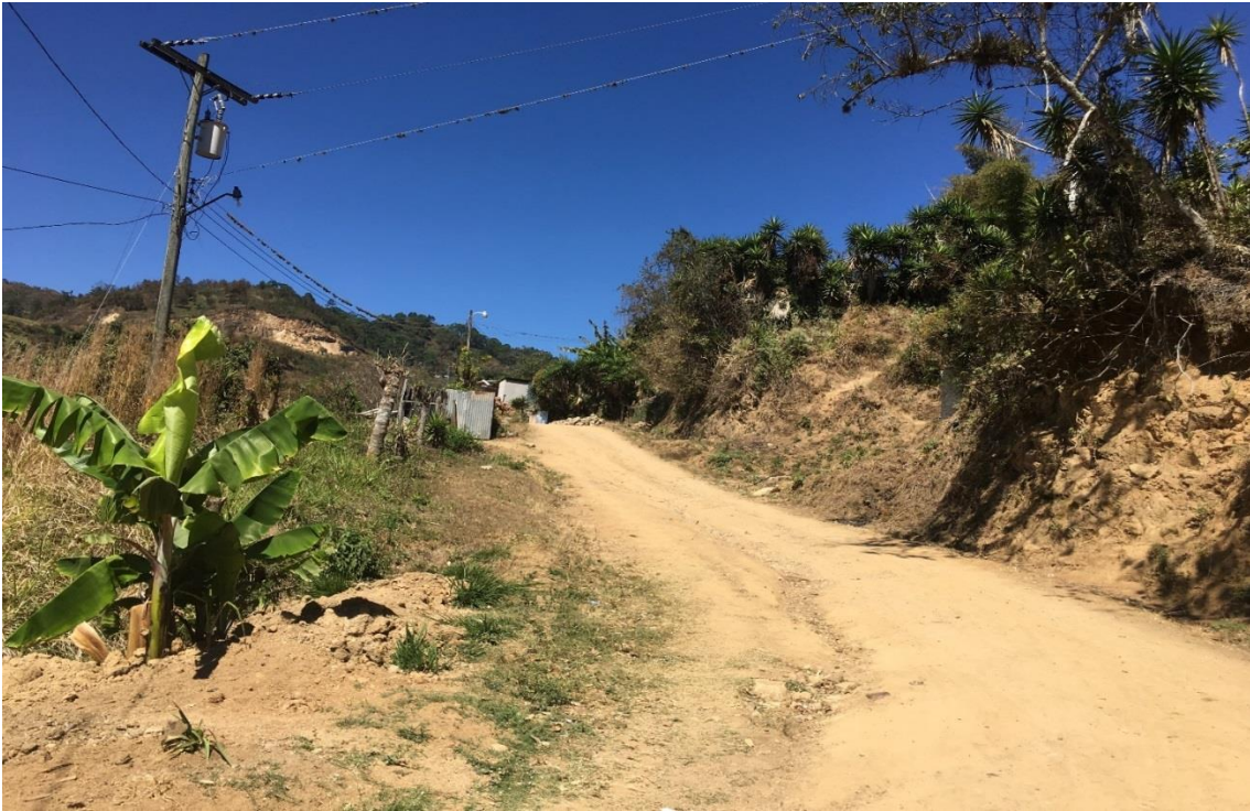
VISTA ACTUAL DEL MAL ESTADO DE LA CALLE