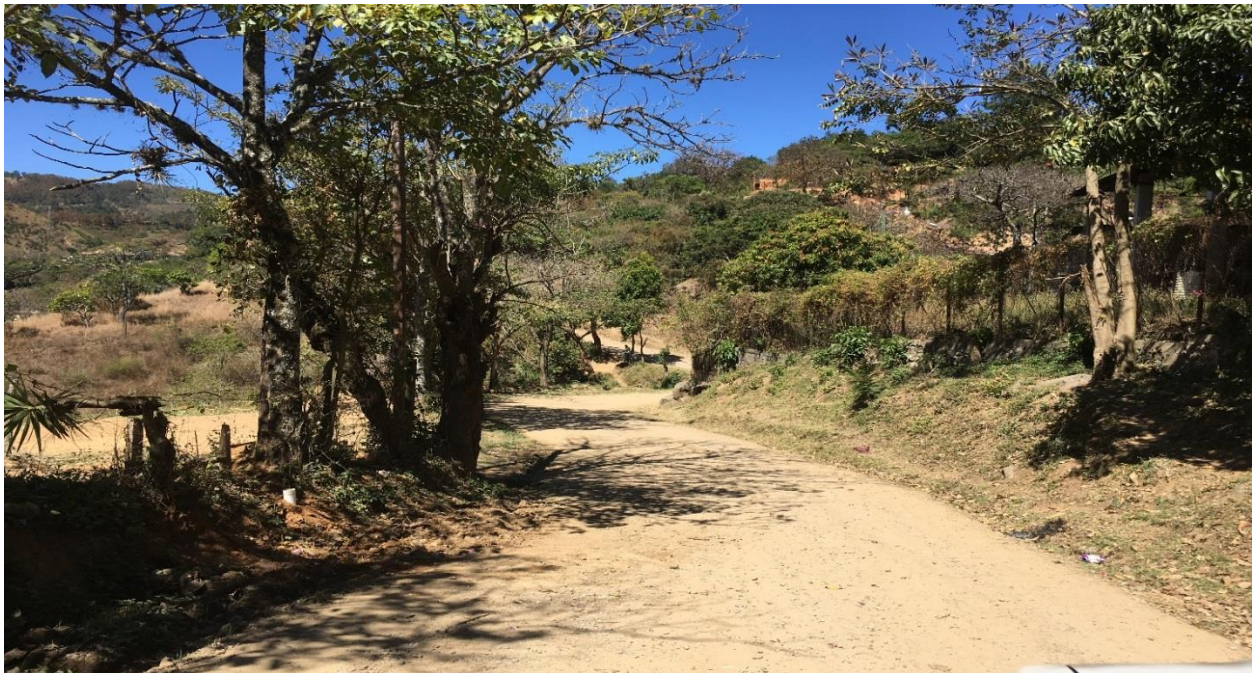
PANORAMA DE CALLE A REPARAR