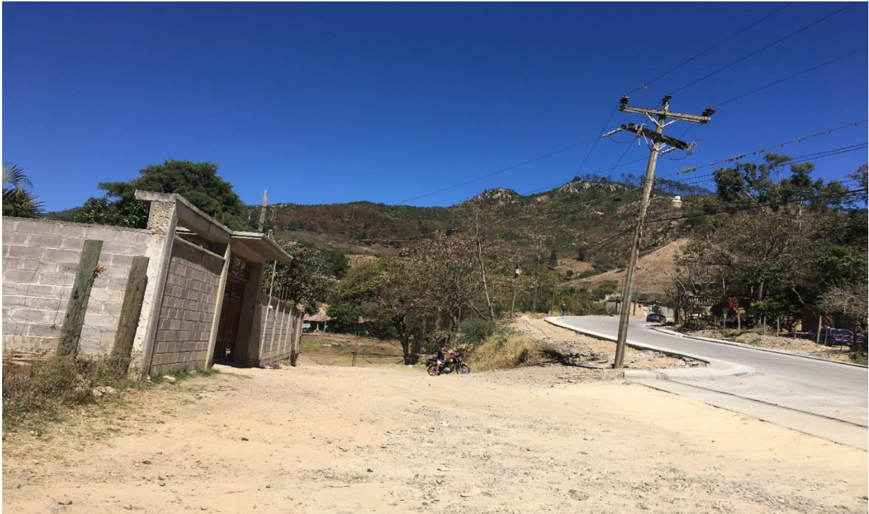
INICIO DE CALLE DONDE SE HARÁN LAS HUELLAS VEHICULARES