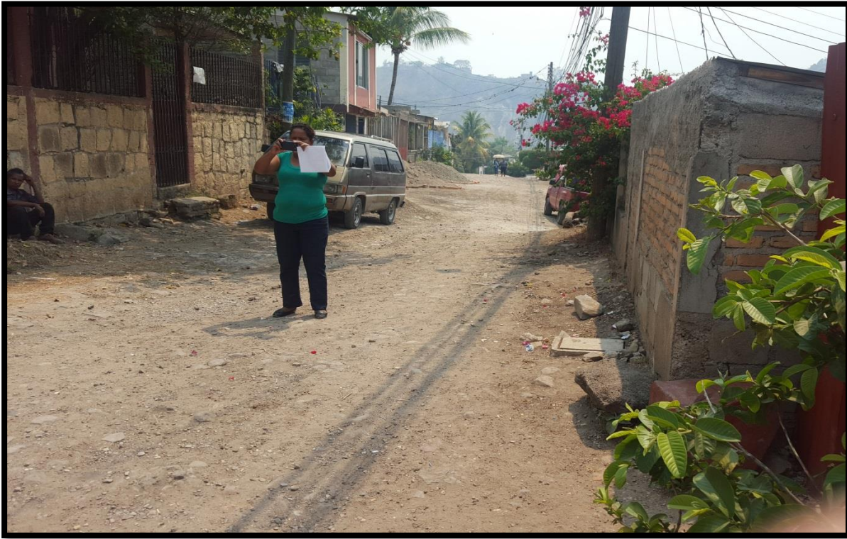
OTRA VISTA DEL MAL ESTADO DE LAS CALLES ACTUALMENTE