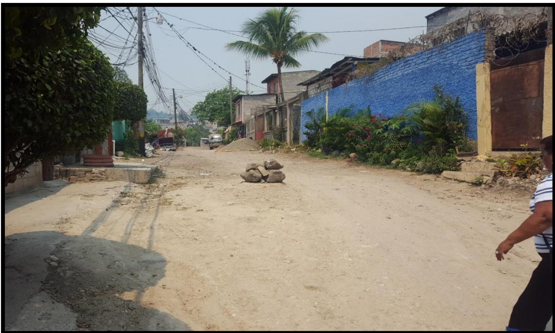
VISTA DEL TRAMO A REPARAR