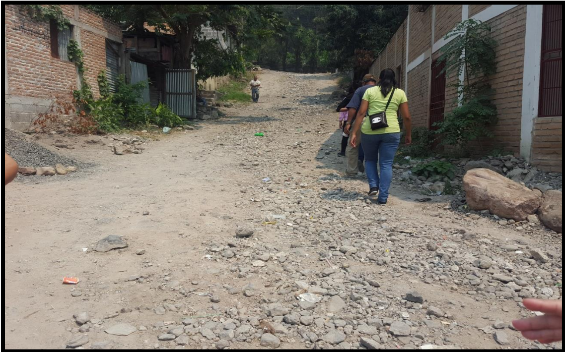
VISTA DEL INICIO DEL TRAMO DE ACCESO A CENTRO DE SALUD