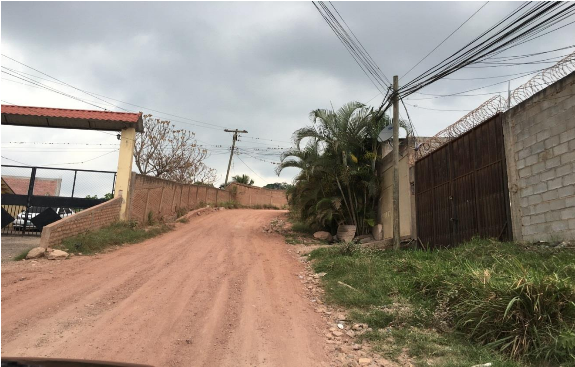
Vista panorámica de la calle