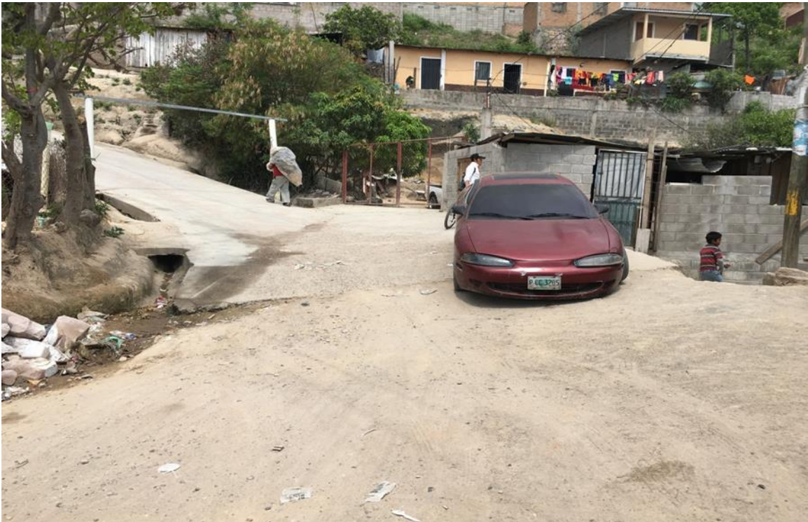
Fin de calle a pavimentar