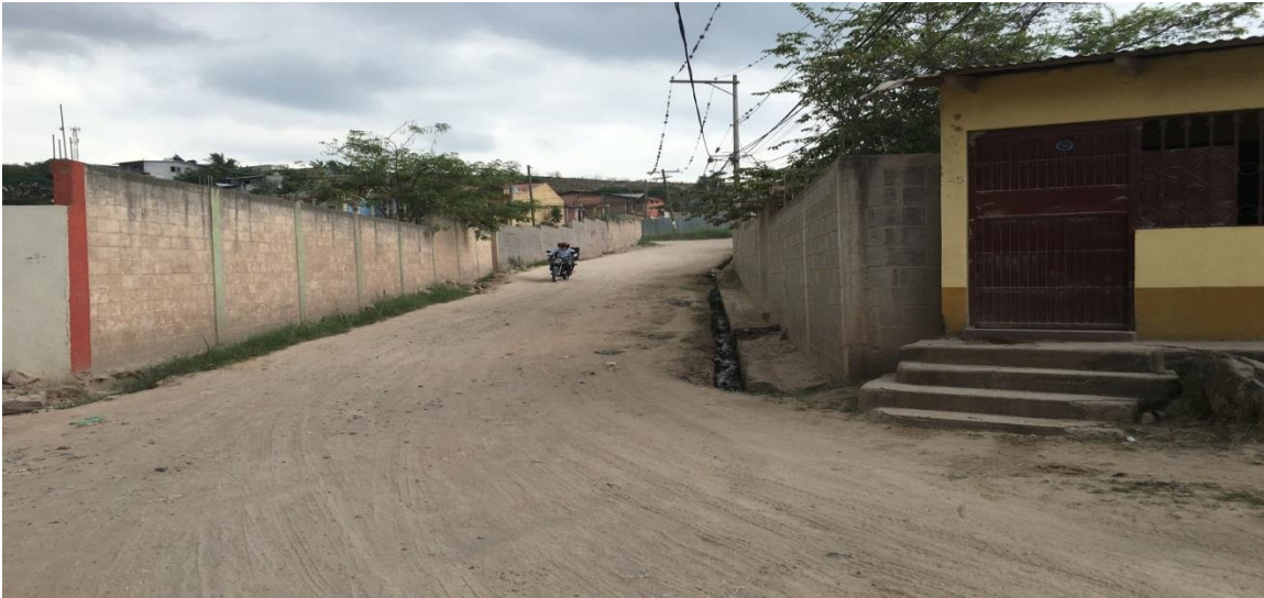
Inicio de la calle a pavimentar