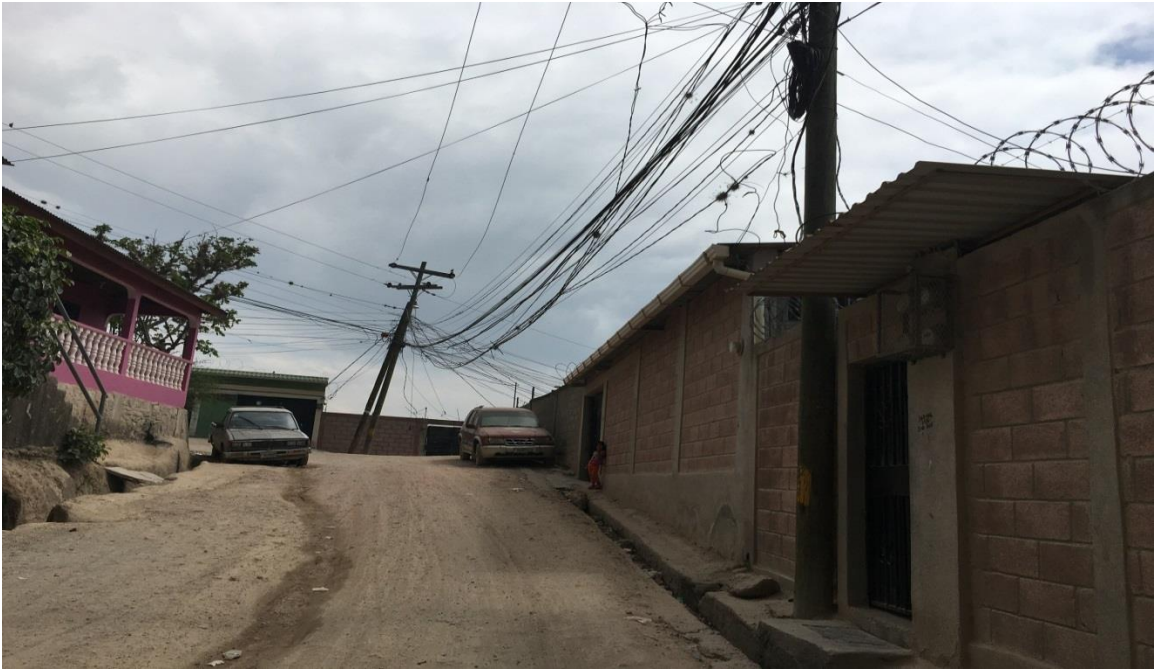
Vista de la calle