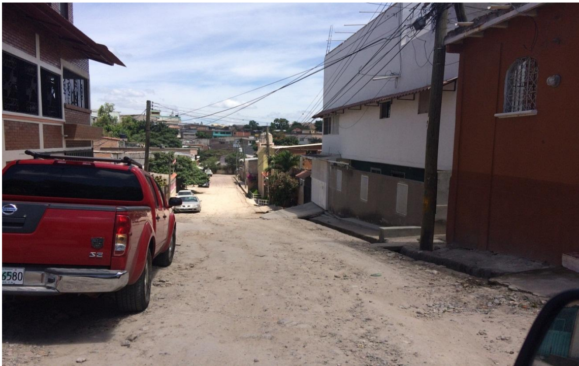
Vista panorámica de calle a pavimentar