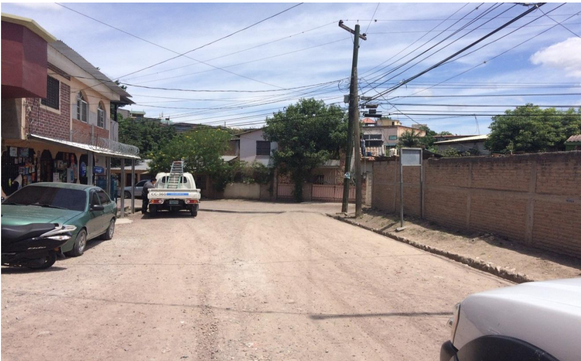
Final de calle a pavimentar