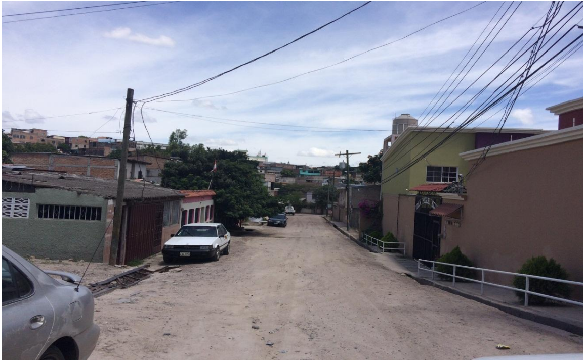
Vista de calle a pavimentar