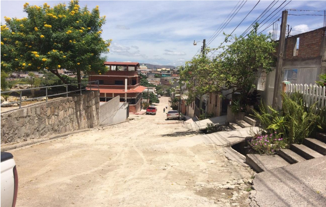
Inicio de calle a pavimentar