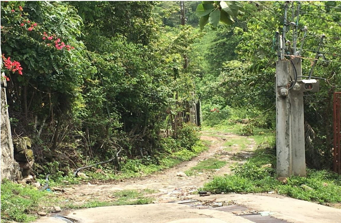
VISTA DEL FINAL DE BALASTADO Y CUNETAS