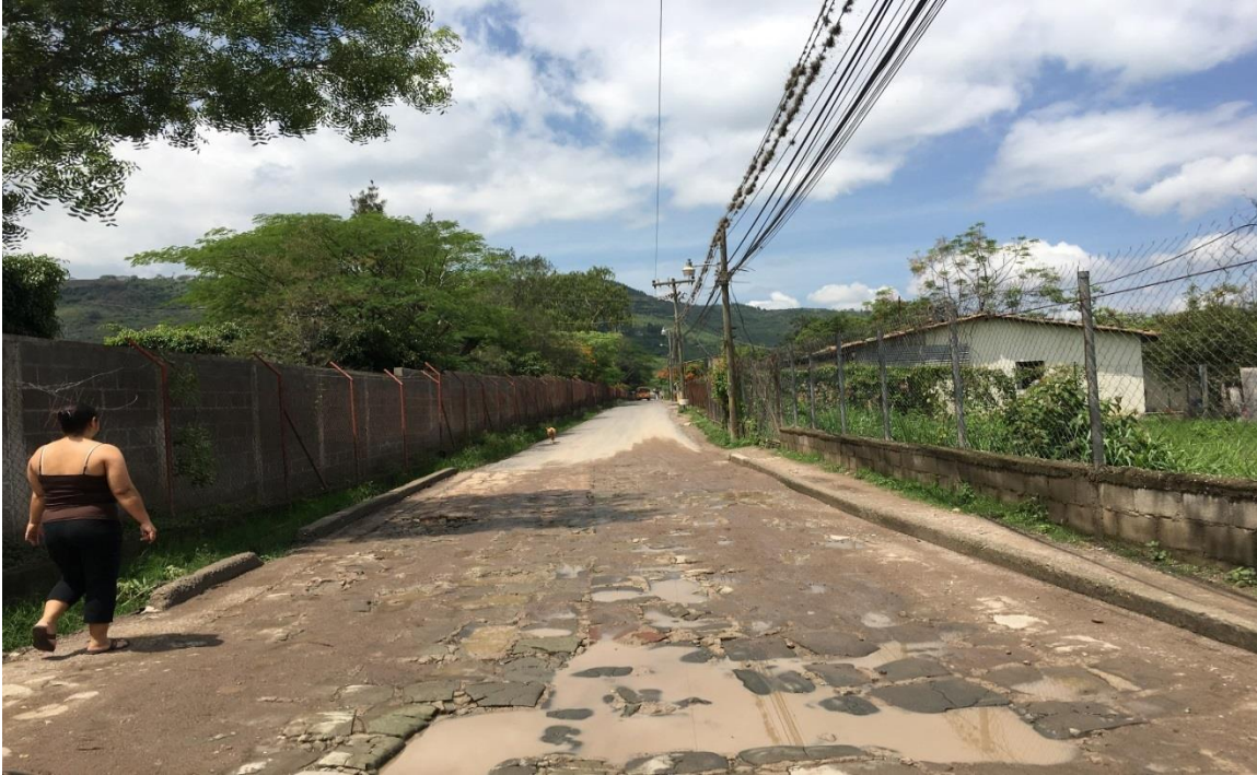
INICIO DE WHITE TOPPING