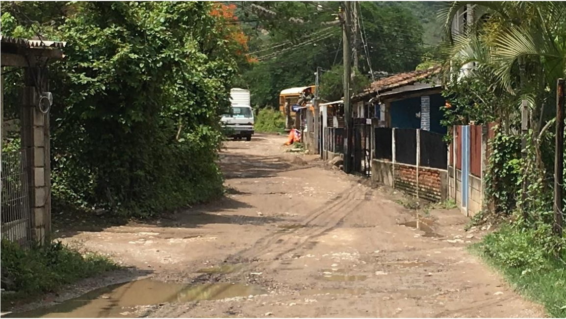
VISTA DEL TRAMO A PAVIMENTAR