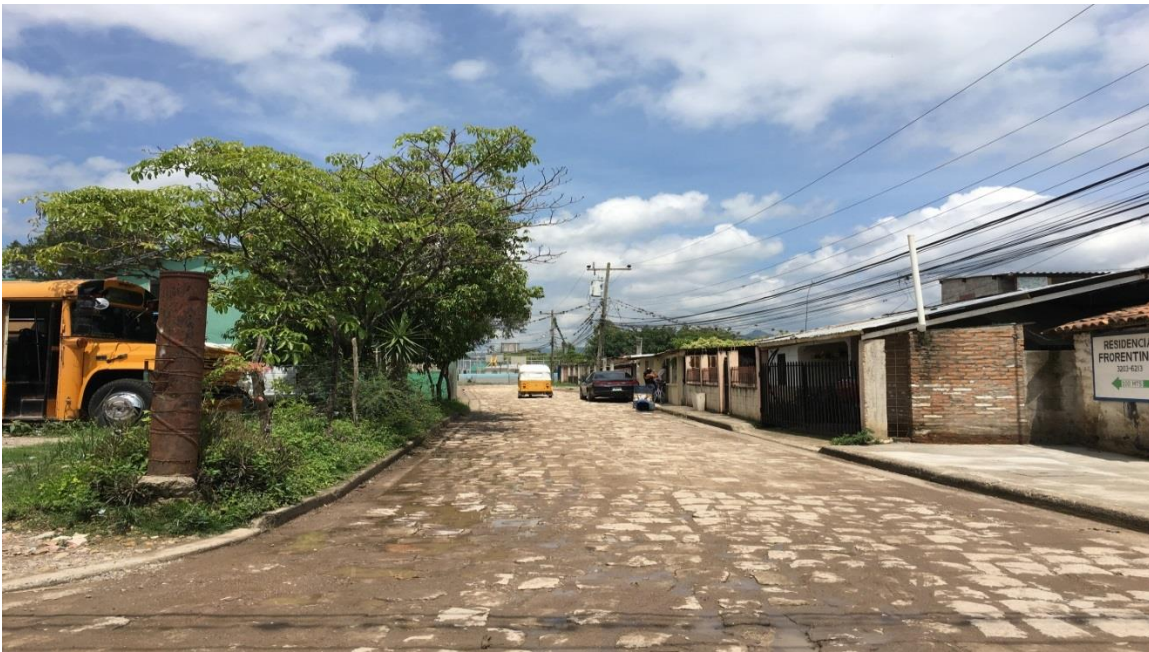
VISTA DE LA REPARACION DEL EMPEDRADO Y WHITE TOPPING