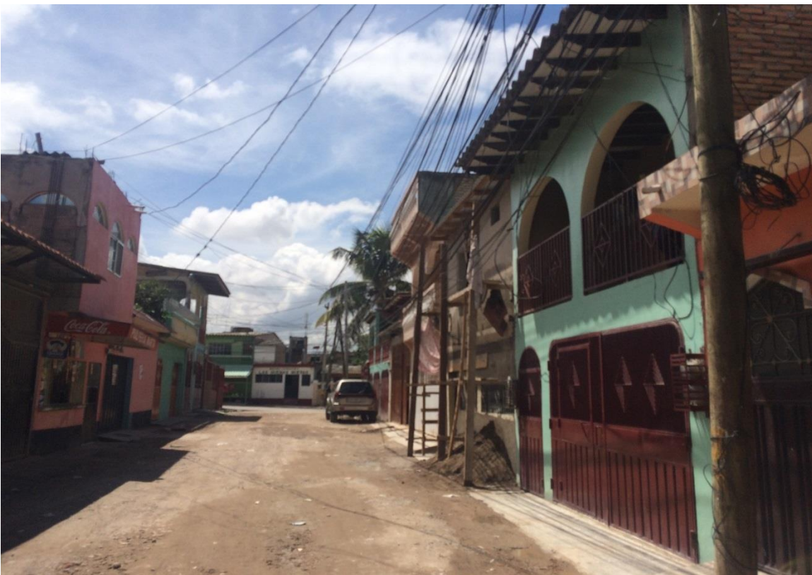
Fin de calle a pavimentar