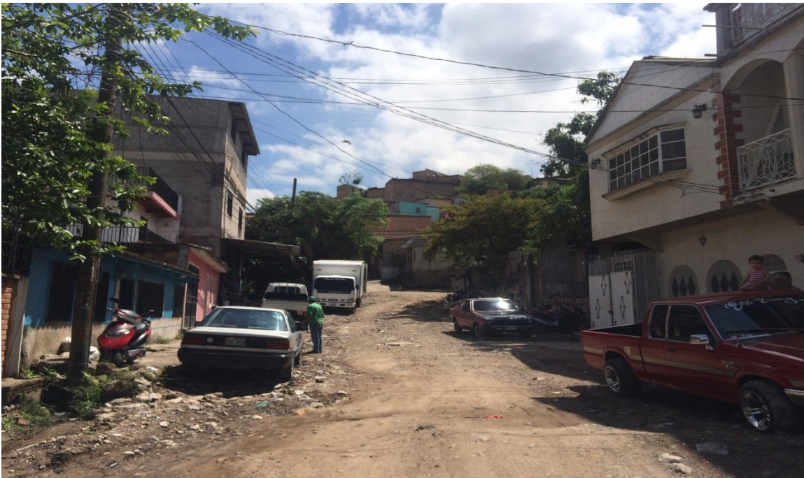
Vista de la calle