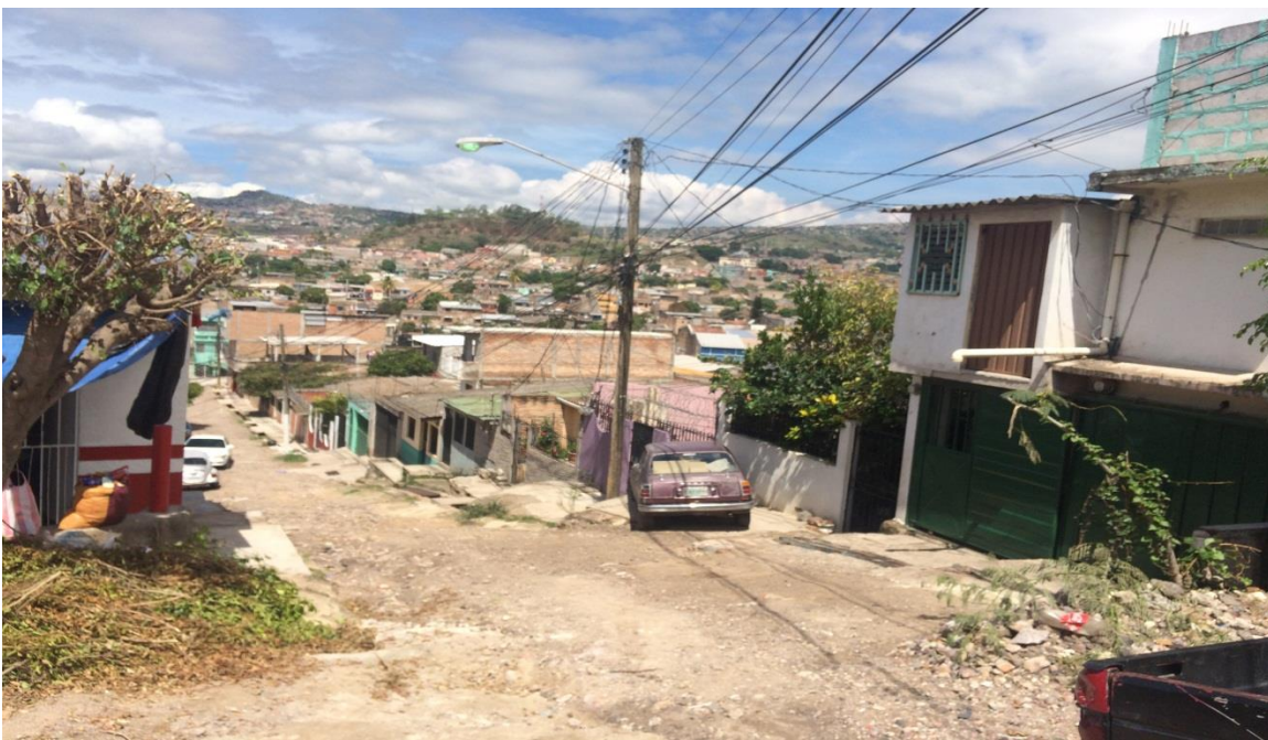
Vista panorámica de la calle