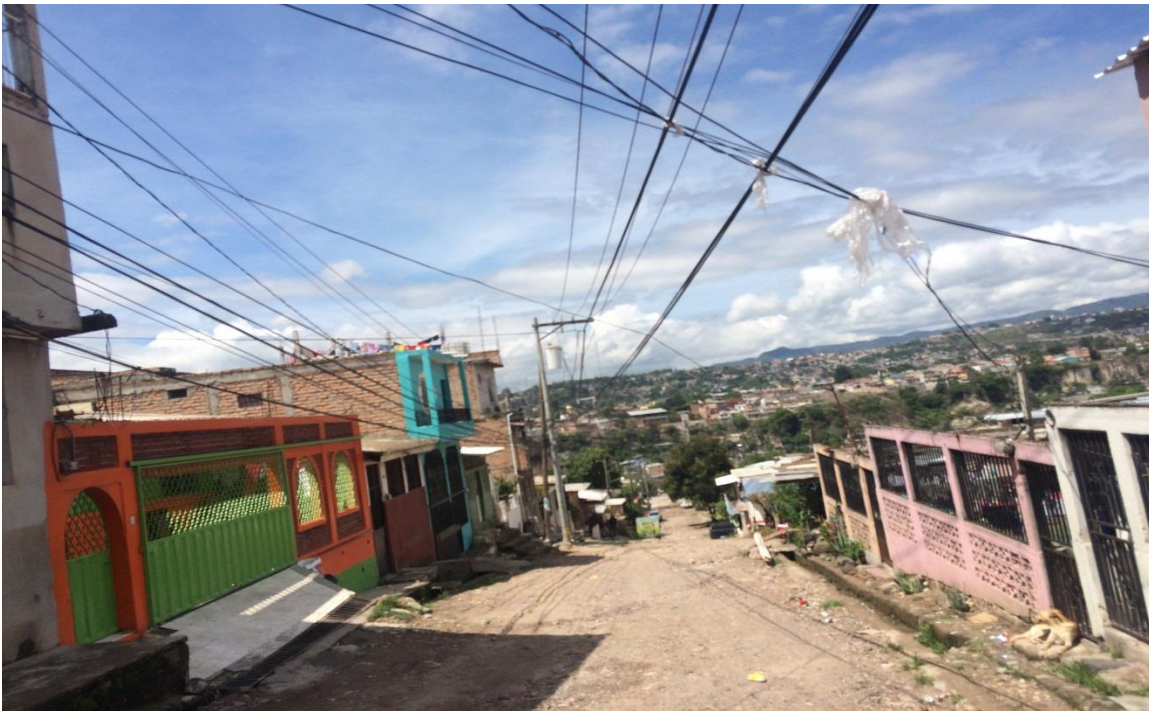
Vista de la calle a pavimentar