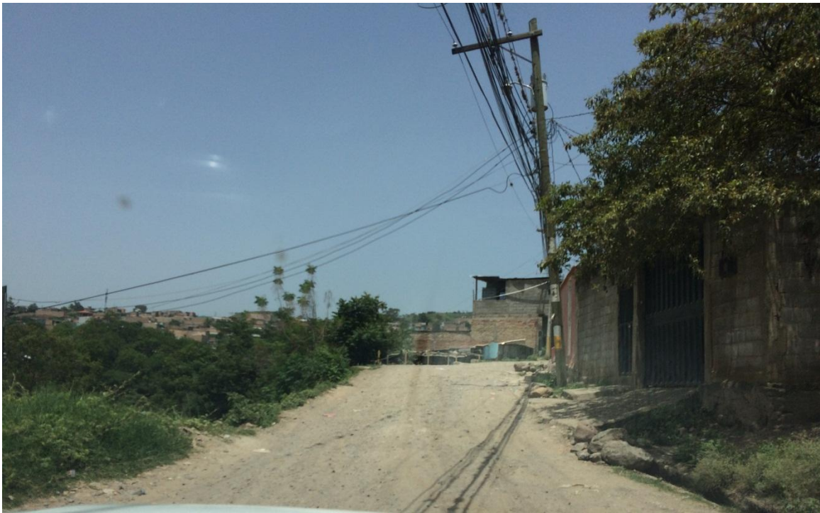
INICIO DE PAVIMENTACION DE CALLE