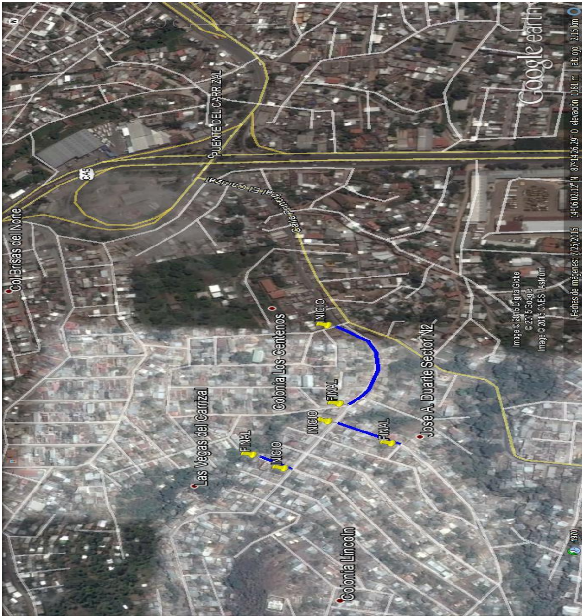
Ubicación del protecto y calles a pavimentar