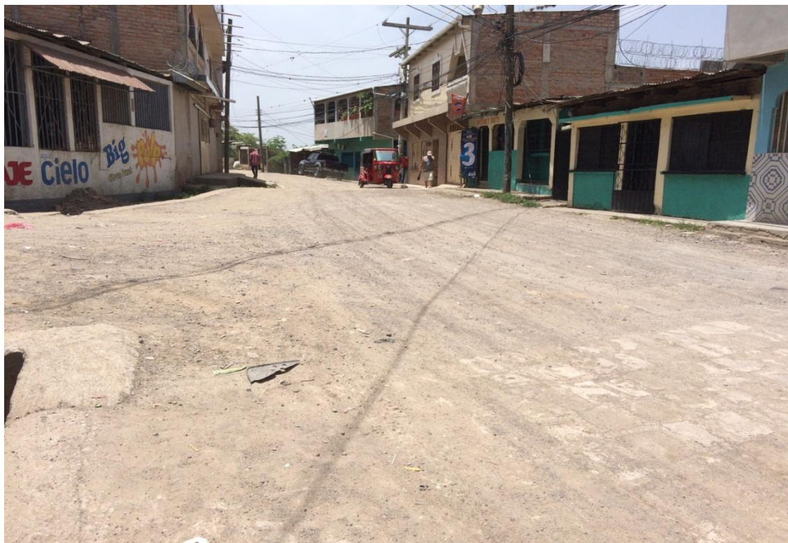
FINAL DE CALLE A PAVIMENTAR