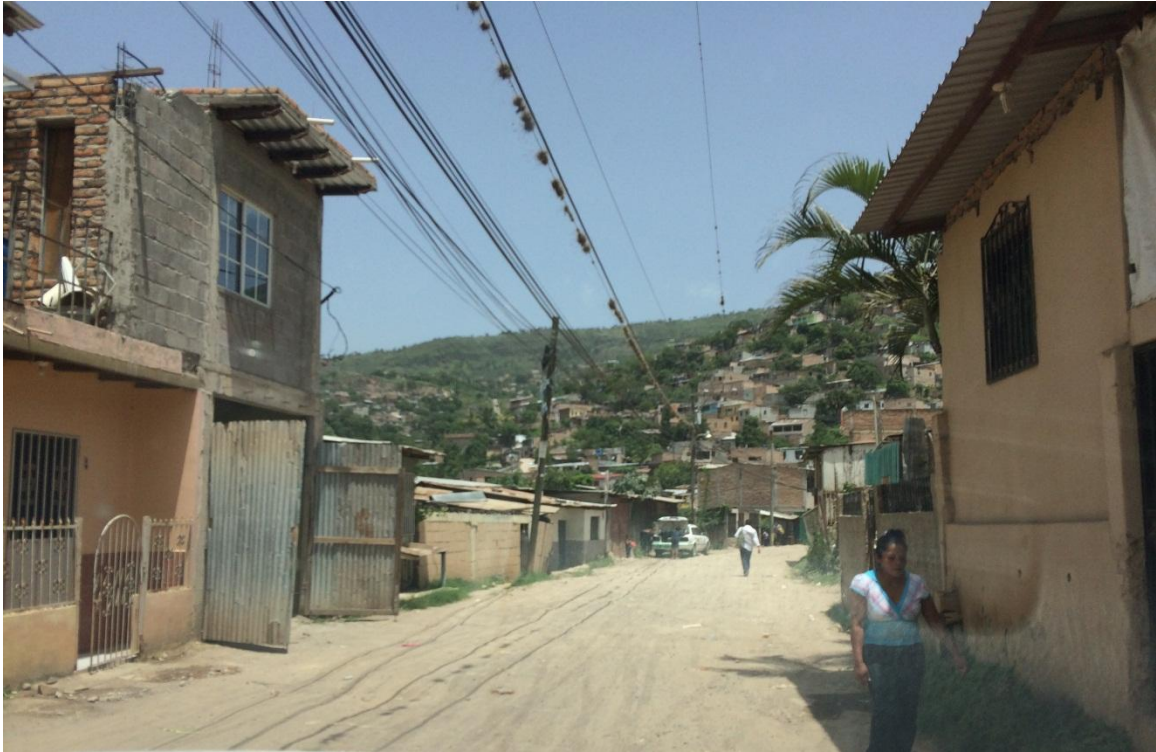
VISTA PANORAMICA DE CALLE A PAVIMENTAR