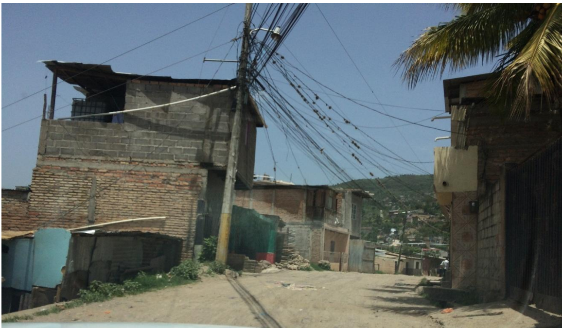
TRAMO DE CALLE A PAVIMENTAR EN COL. LOS CENTENOS NO. 2