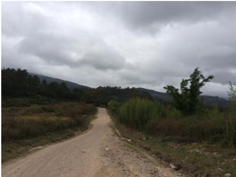
VISTA PANORÁMICA DE LA CALLE

Proyecto: Conformación y balastado de calles, aldea El Carrizal, desvío en salida a Danlí Código: 1569