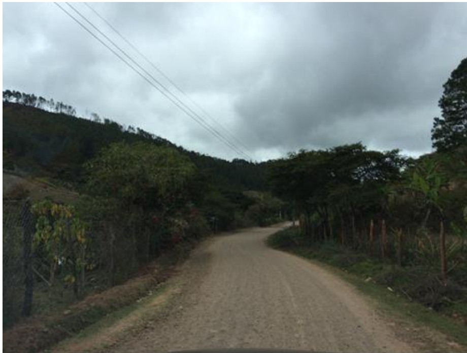
VISTA ACTUAL DE CALLE A REPARAR