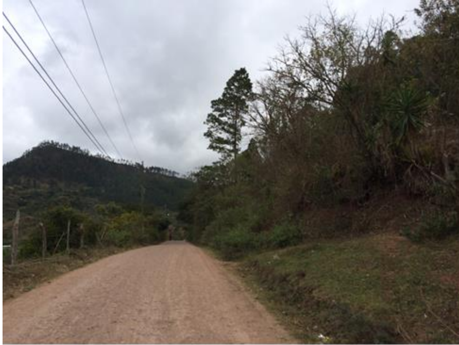
INICIO DE CALLE A BALASTAR Y CONFORMAR