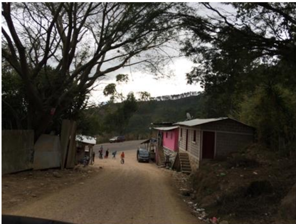
FINAL DE OBRA A EJECUTAR