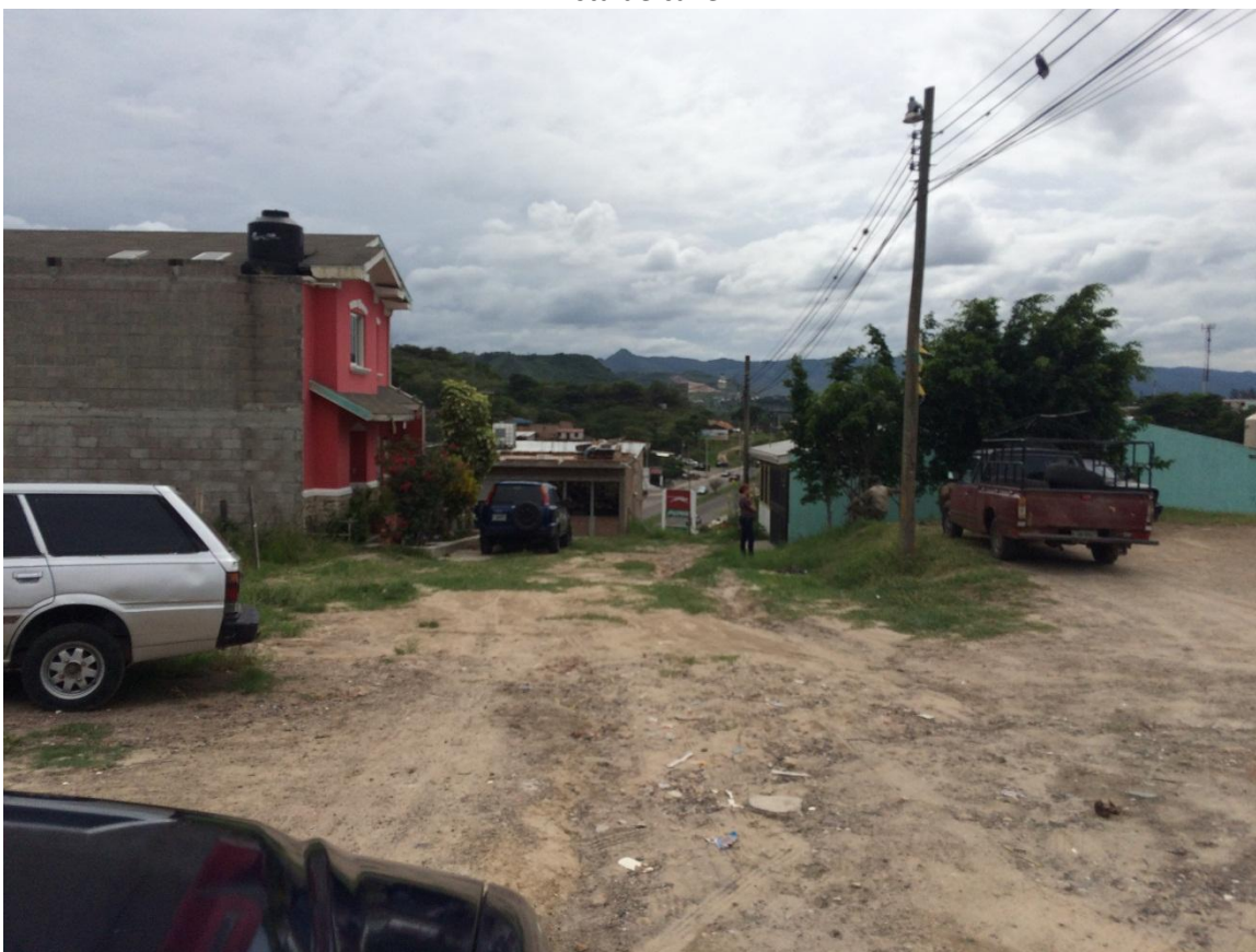
Fin de calle a pavimentar