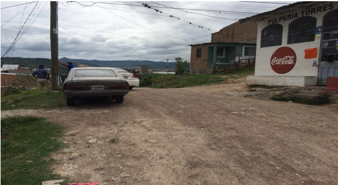
Inicio de calle a pavimentar