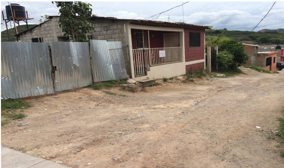
Vista de calle