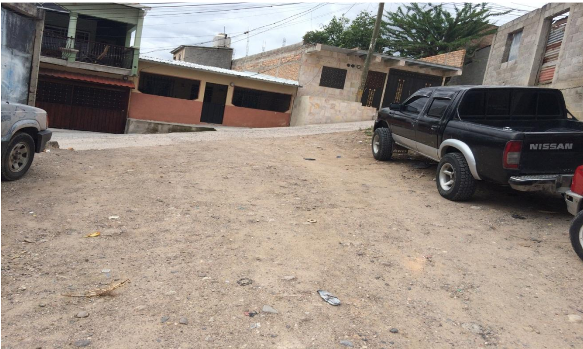
Vista panorámica de la calle a pavimentar