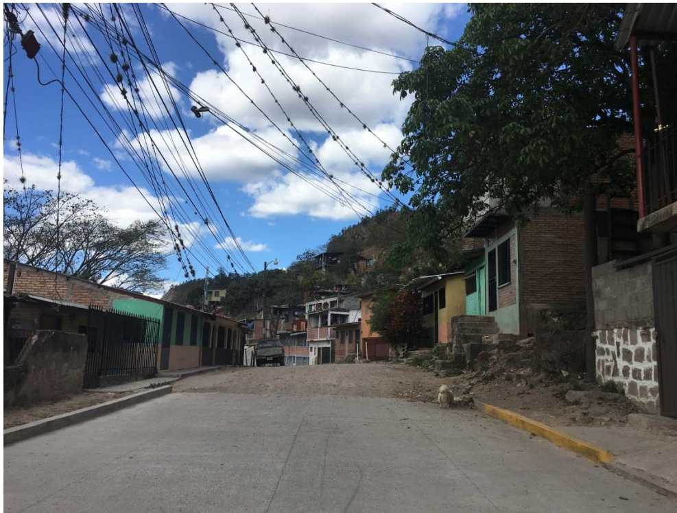
INICIO DE CALLE EN QUE SE EJECUTARÁ LA OBRA