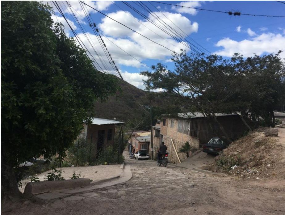
VISTA DE LA CALLE EN QUE SE DEMOLERÁ EL EMPEDRADO Y SE PAVIMENTARÁ CON CONCRETO HIDRÁULICO