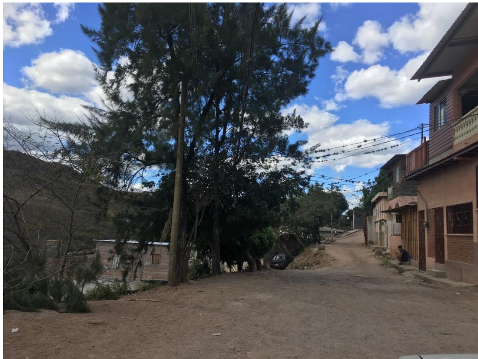
VISTA DE CALLE A PAVIMENTAR CON CONCRETO HIDRÁULICO