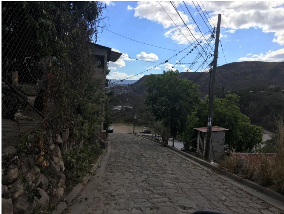
CALLE A PAVIMENTAR CON CONCRETO HIDRÁULICO