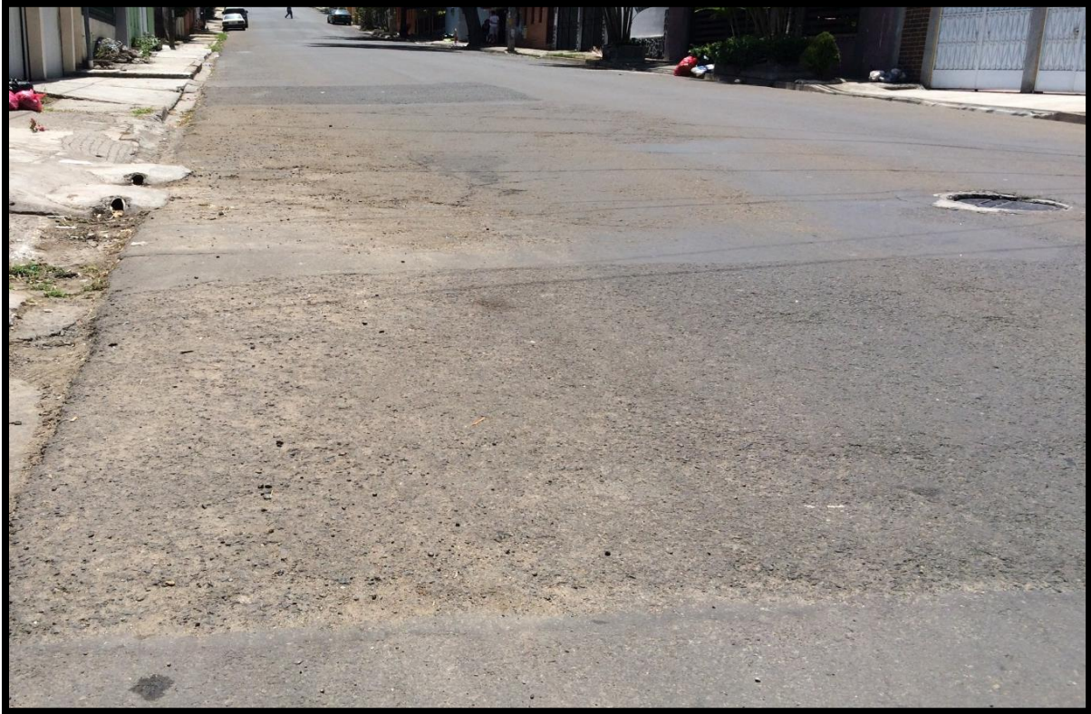
Vista panorámica del tramo en mal estado