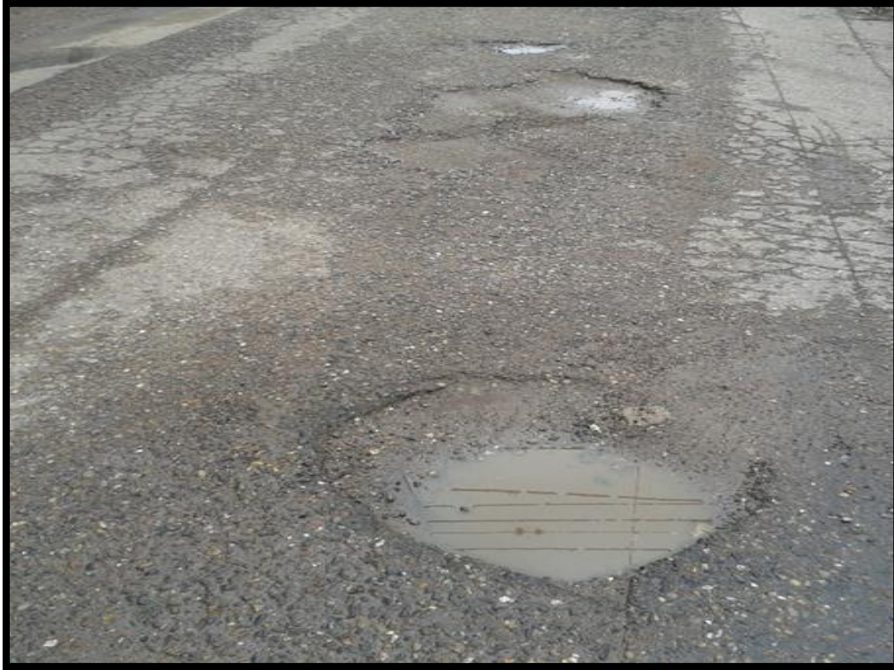
Baches en col. Los angeles

Proyecto: Bacheo con mezcla asfáltica en col. Primavera y col. Los Ángeles Código: 1030