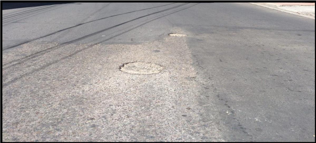
Tramo en col. Primavera con baches existentes