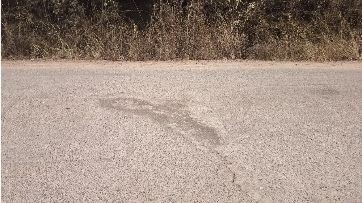
En la imagen se aprecia el desgaste de la calzada existente en la colonia Villeda Morales