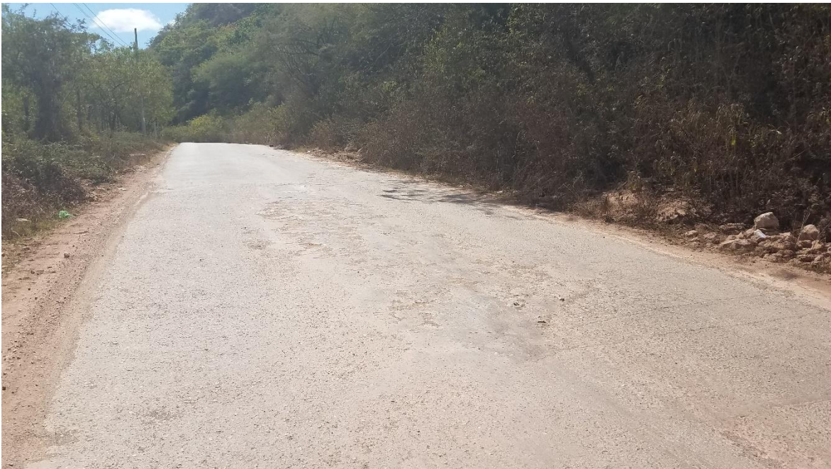
En la imagen se muestra el tramo final de la calle a bachear con mezcla asfáltica