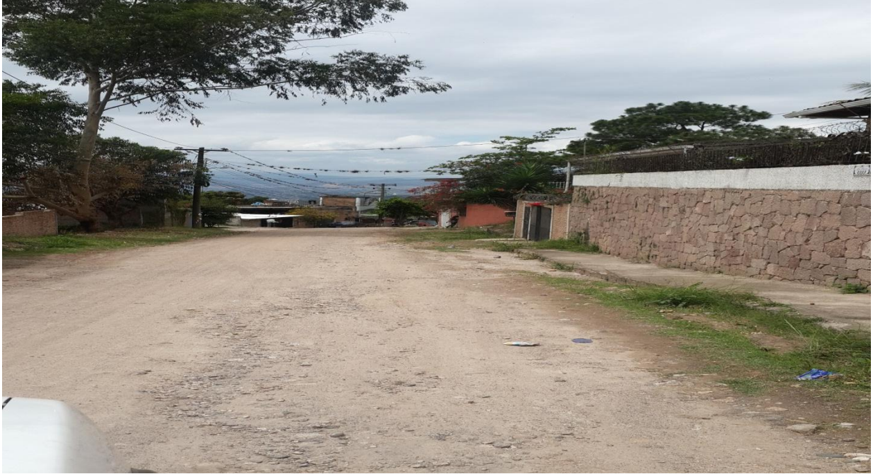
VISTA PANORAMICA DE PAVIMENTACION