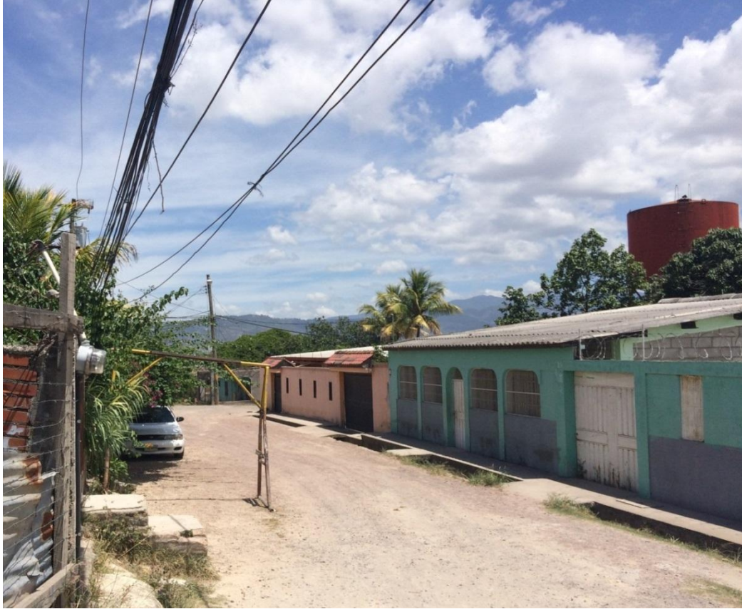
TRAMO A PAVIMENTAR EN COL. 14 DE MARZO