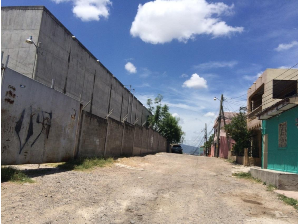
INICIO DE PAVIMENTACION DE CALLE