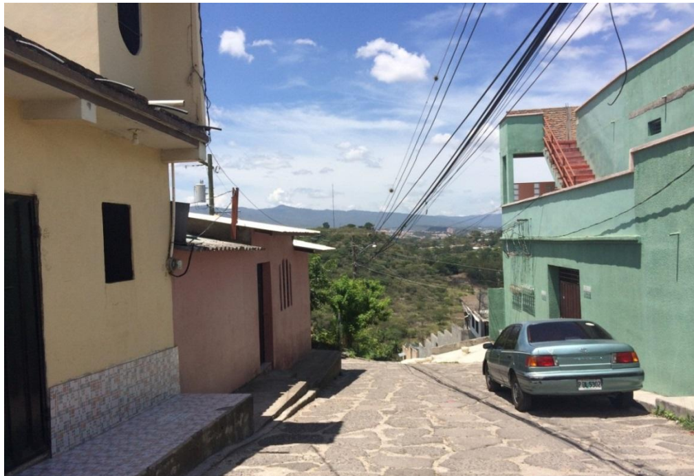
VISTA PANORAMICA DE CALLE A PAVIMENTAR