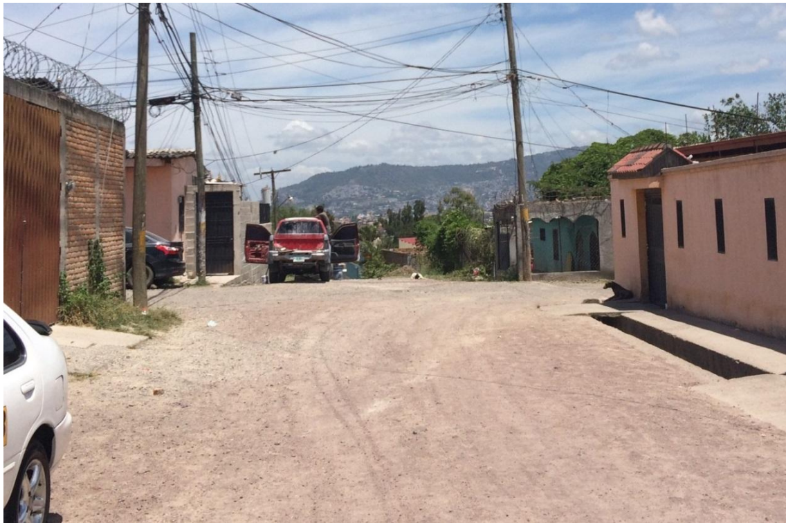
FINAL DE CALLE A PAVIMENTAR