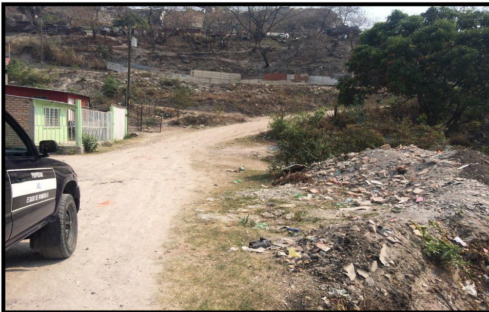
OTRA VISTA DEL MAL ESTADO DE LAS CALLES ACTUALMENTE