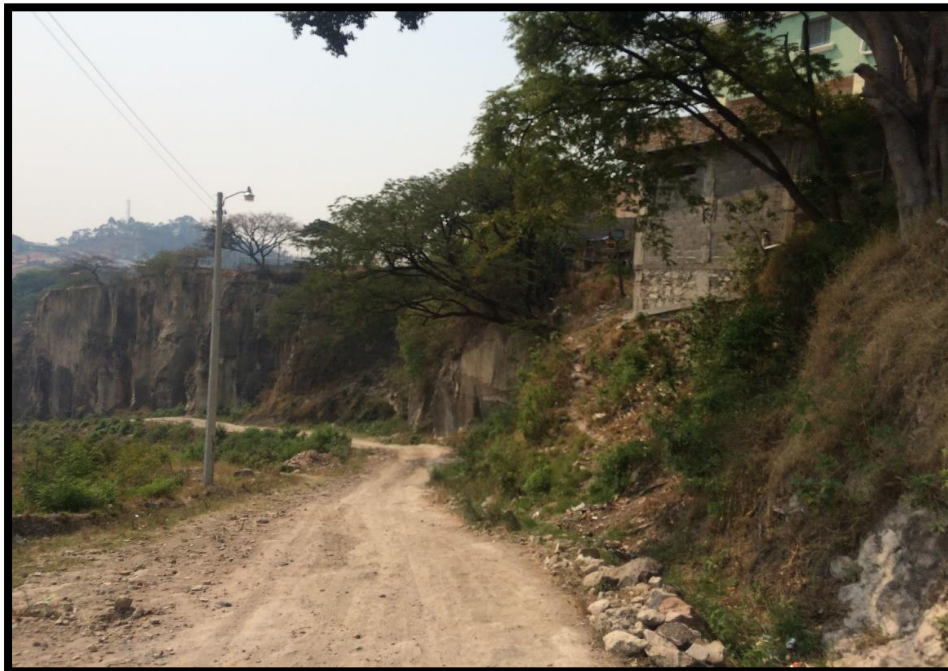
VISTA DEL TRAMO A PAVIMENTAR