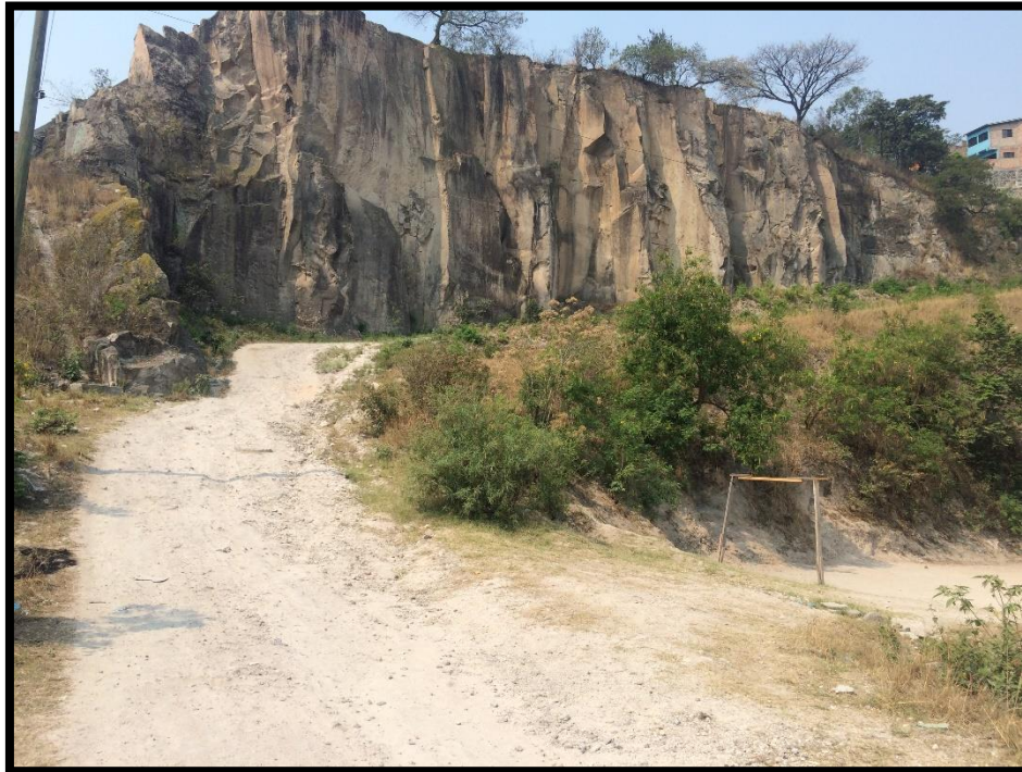
VISTA DEL INICIO DEL TRAMO DE ACCESO A COL. SUPERACIÓN