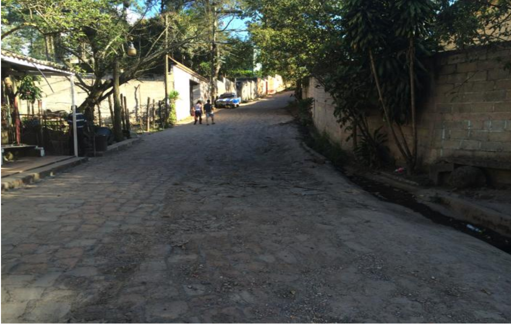
Vista panorámica del tramo a pavimentar