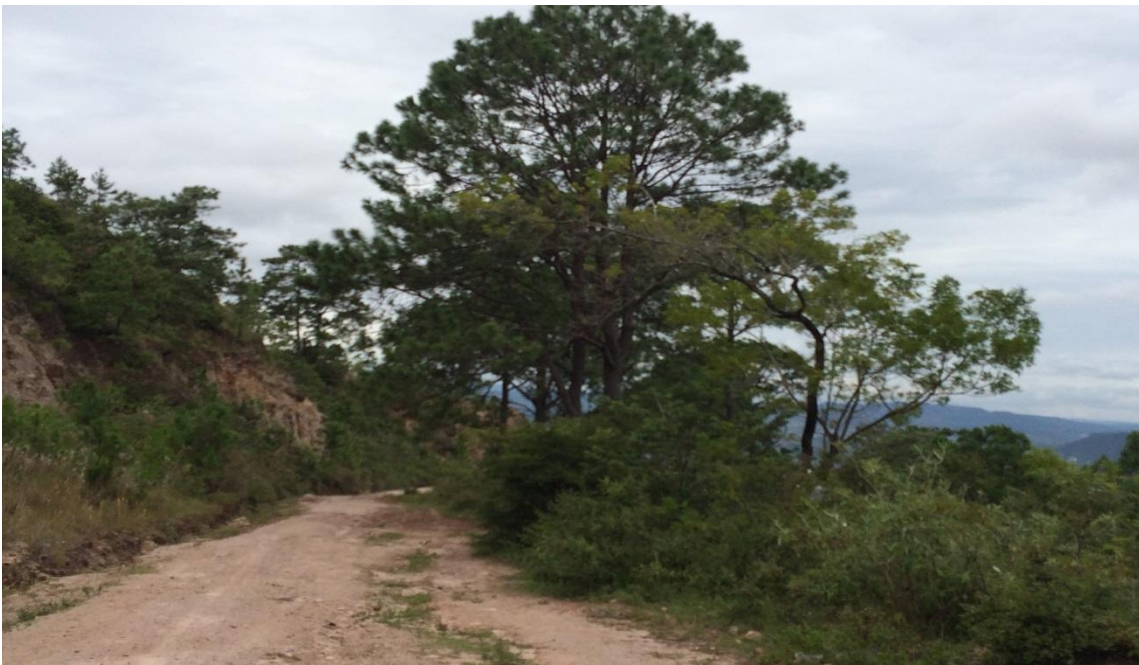
Tramo de Calle a Reparar