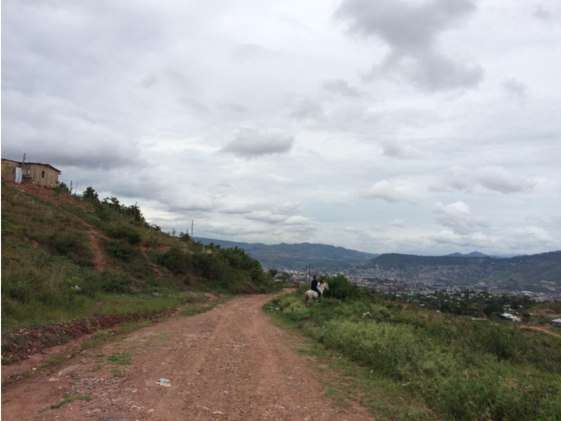
Vista Panorámica de Calle a Reparar