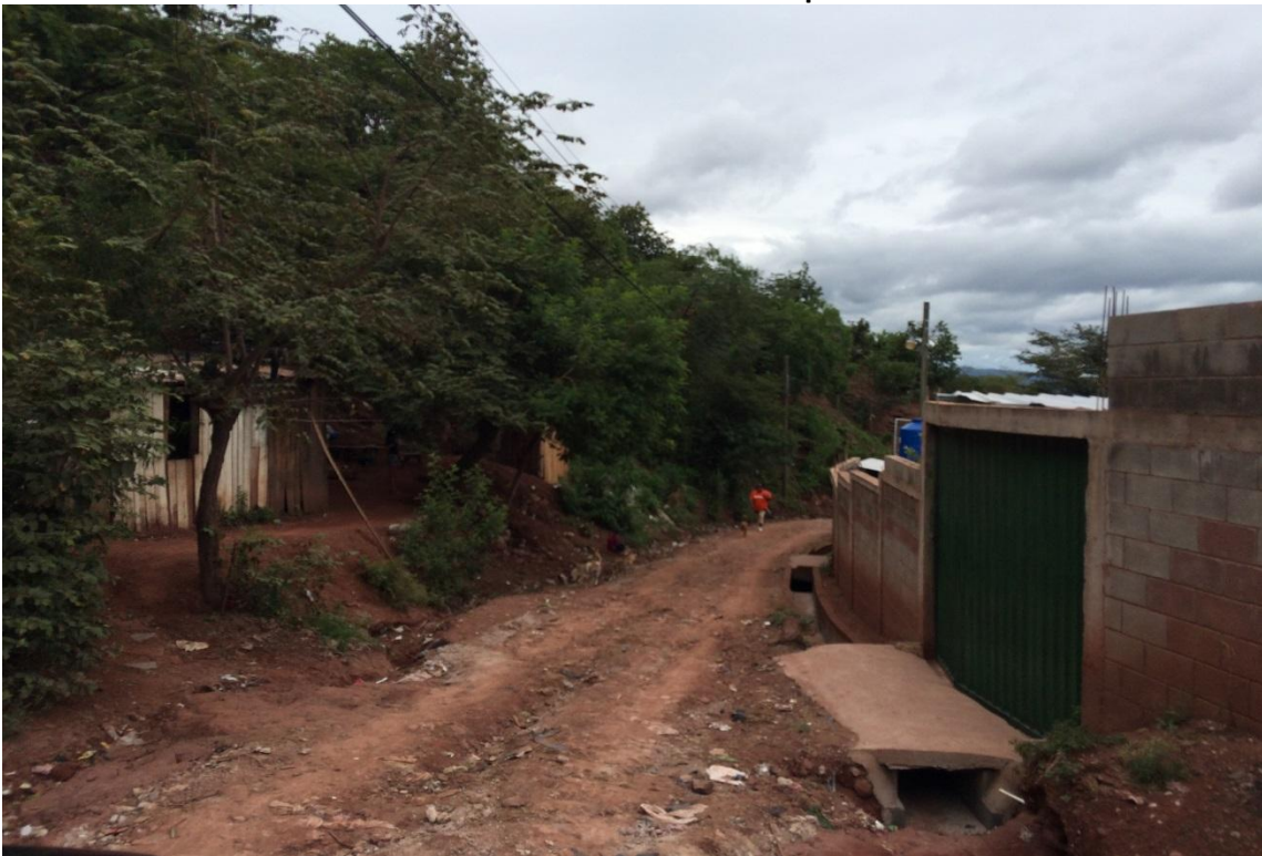
Final del proyecto