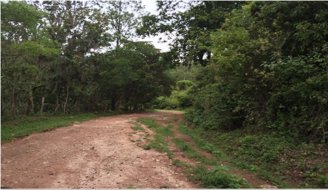
Inicio del Proyecto,