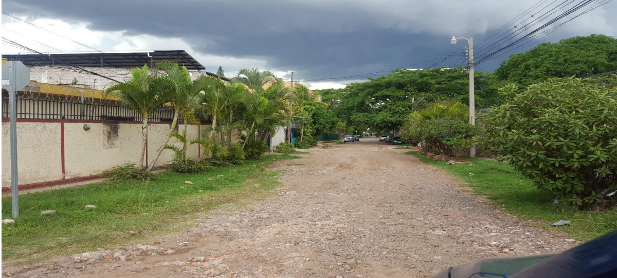
PANORÁMA DE TRAMO A PAVIMENTAR

Proyecto: Pavimentación de calle con concreto hidráulico, col. Lara Código: 1192