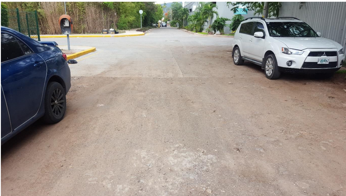
FINAL DE TRAMO A PAVIMENTAR