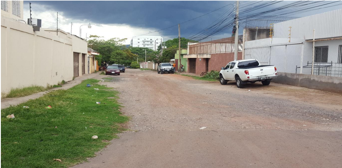
INICIO DE TRAMO A PAVIMENTAR