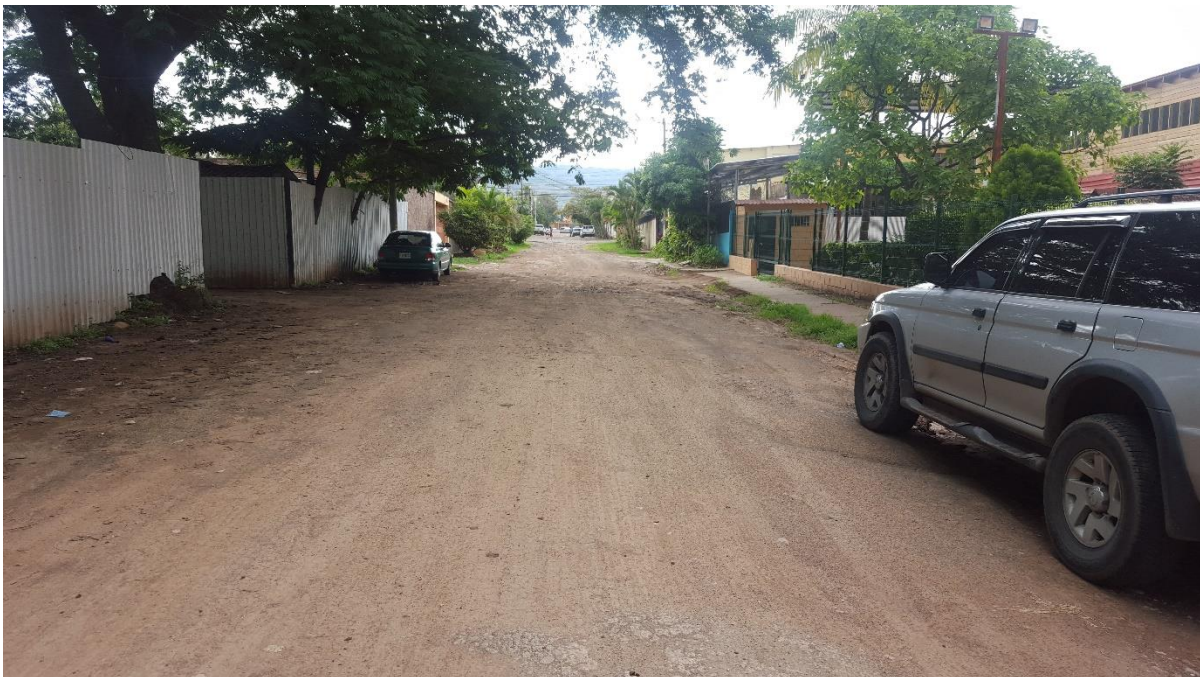
PANORÁMA DE TRAMO A PAVIMENTAR