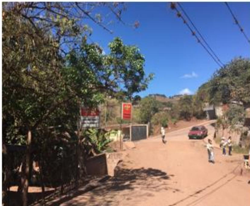
FINAL DE TRAMO A PAVIMENTAR CON CONCRETO HIDRÁULICO