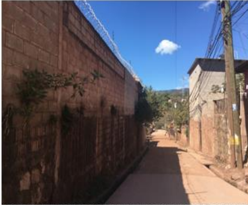
INICIO DE TRAMO A PAVIMENTAR CON CONCRETO HIDRÁULICO