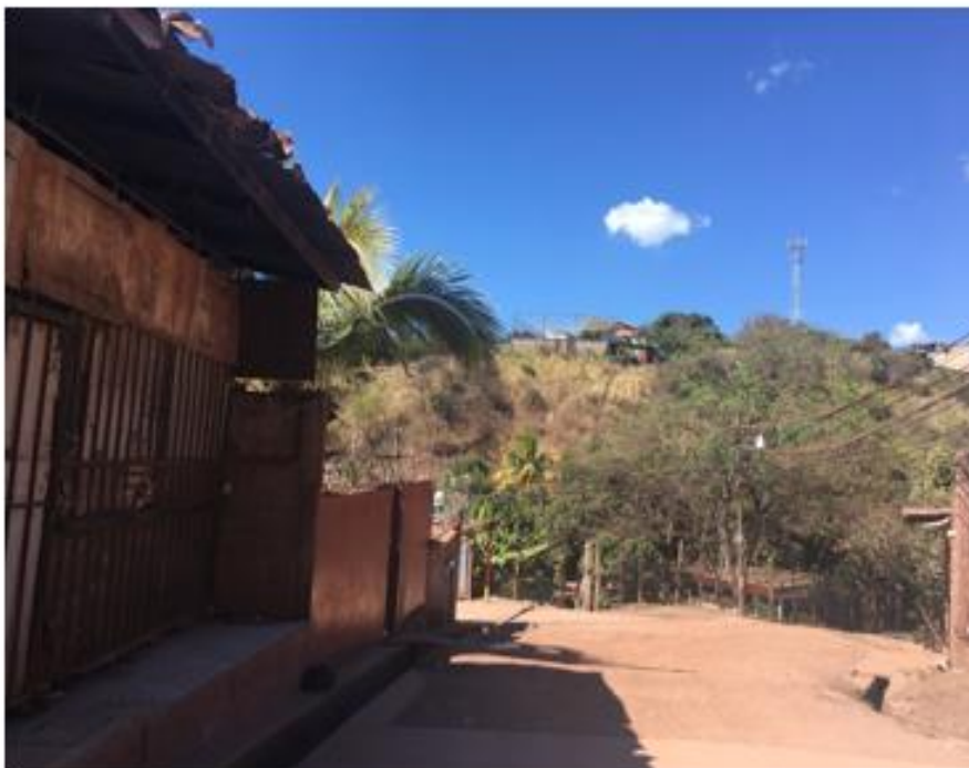
INICIO DE TRAMO A PAVIMENTAR