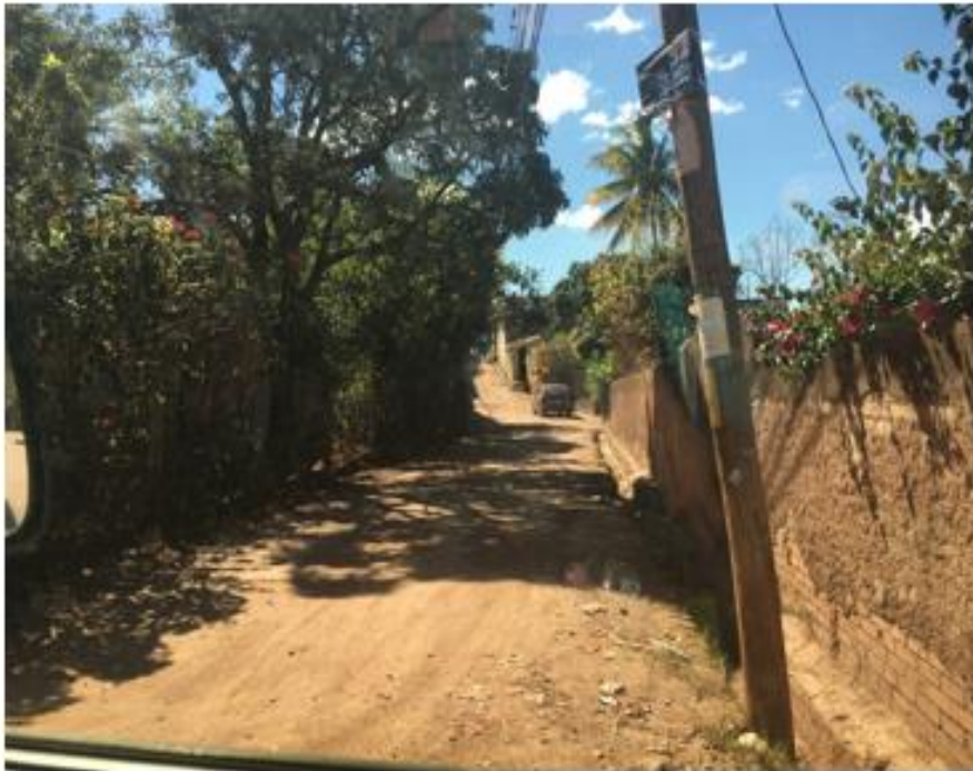
PANORÁMA DE LA CALLE A PAVIMENTAR

Proyecto: Pavimentación de calle con concreto hidráulico, col. La Era, sector El Pozo Código: 1578