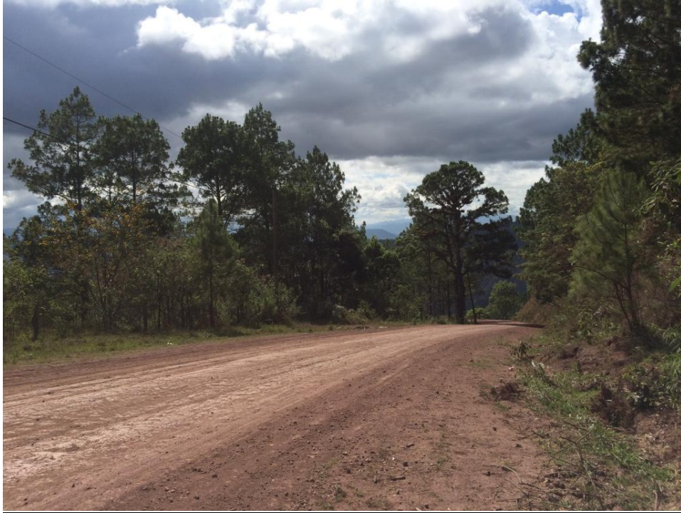
Inicio del Proyecto, en las cercanías del caserío Los Albergues