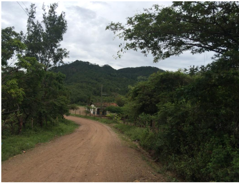
Final del proyecto Aldea Guachipilín