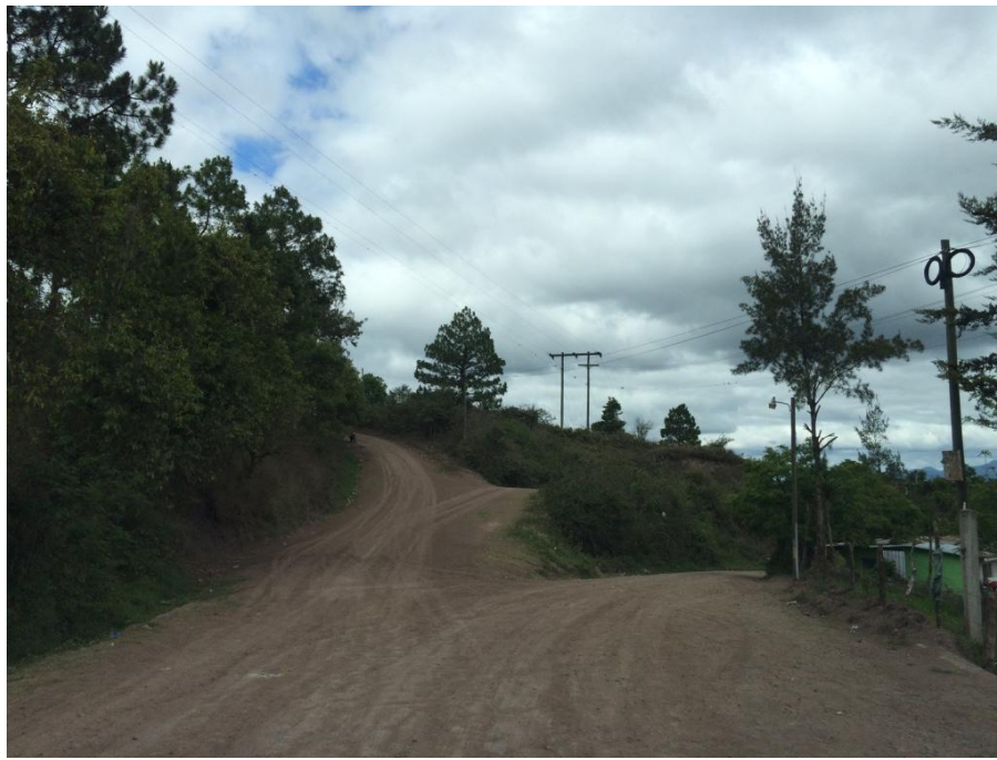
Vista Panorámica de un Tramo del Proyecto en el Cruce de Cantagallo