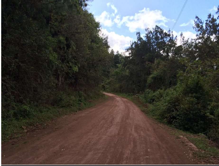
Vista Panorámica de un Tramo del Proyecto