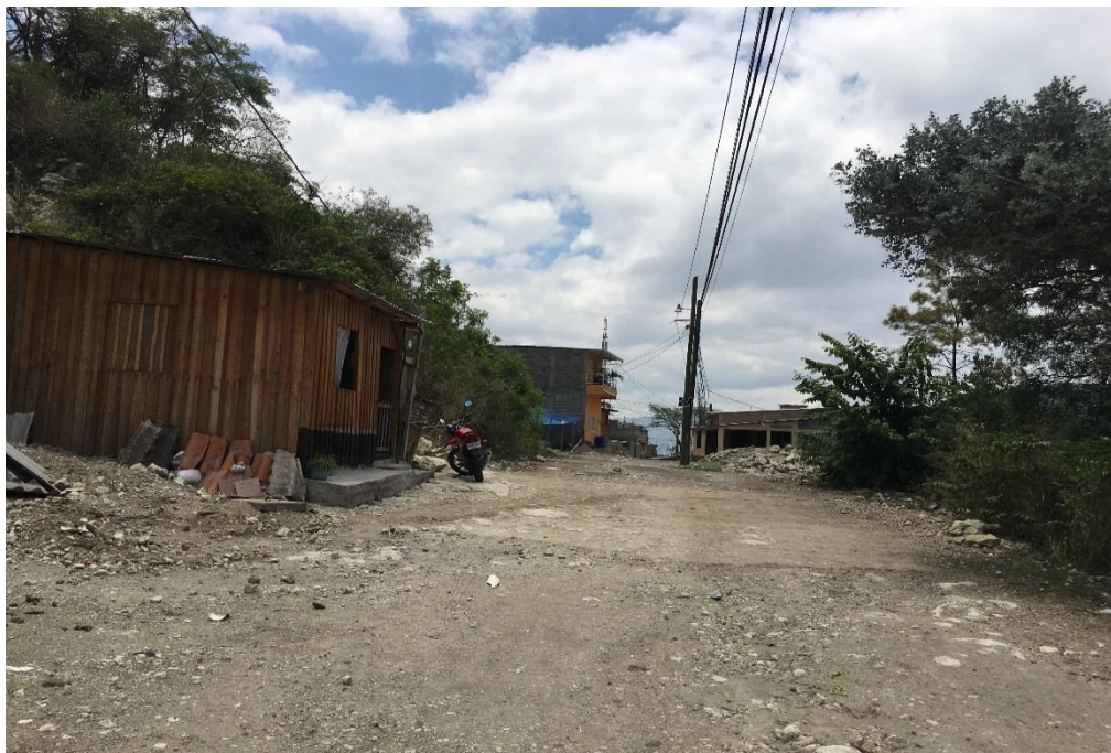
VISTA DE CALLE DEL TRAMO 3