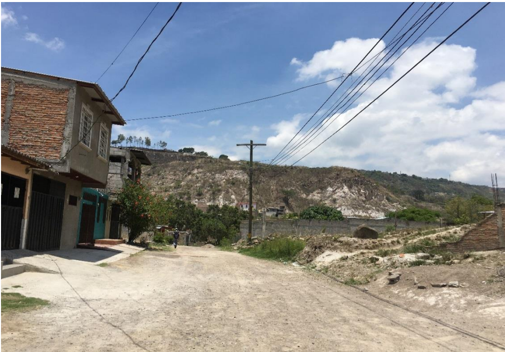
VISTA PANORÁMICA DEL TRAMO A PAVIMENTAR