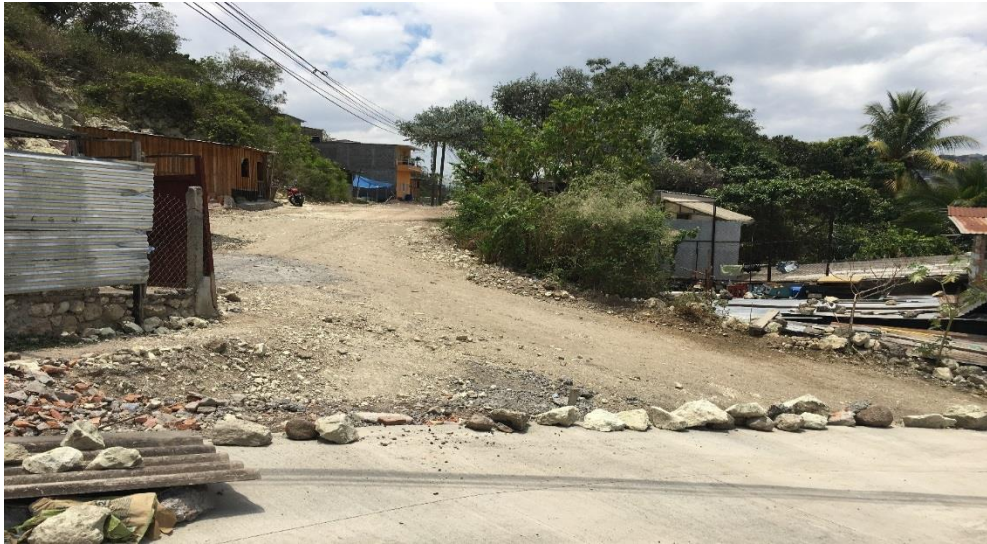
INICIO DEL TRAMO 3