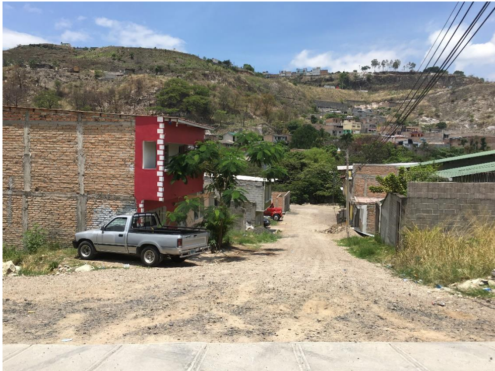
INICIO DE TRAMO A PAVIMENTAR EN TRAMO 2