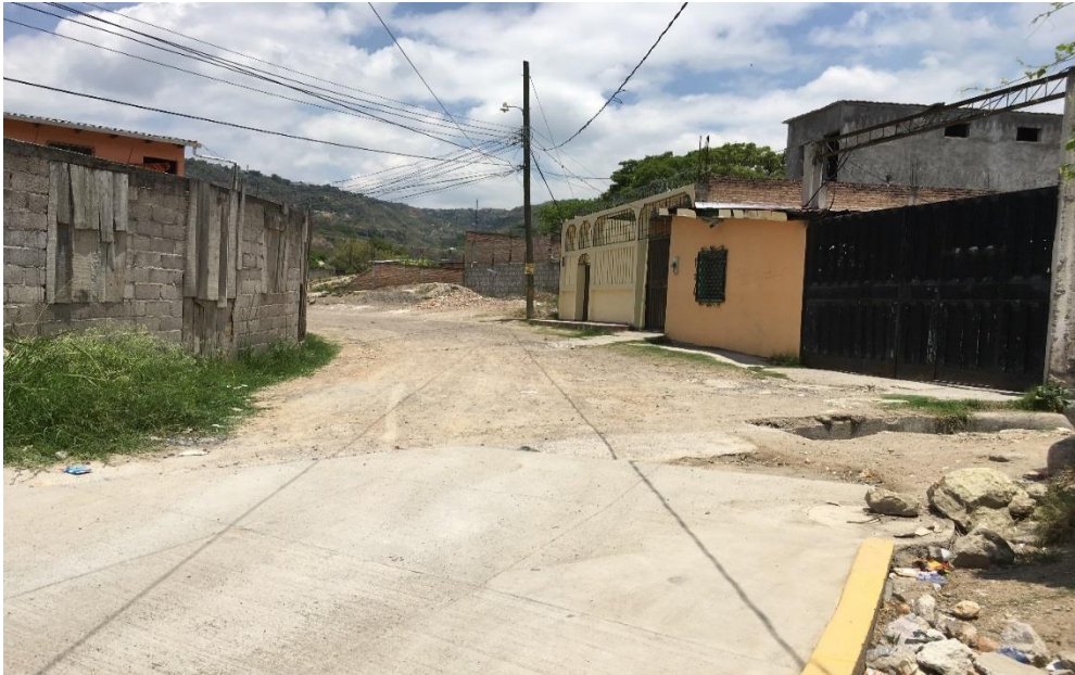
INICIO DEL TRAMO A PAVIMENTAR