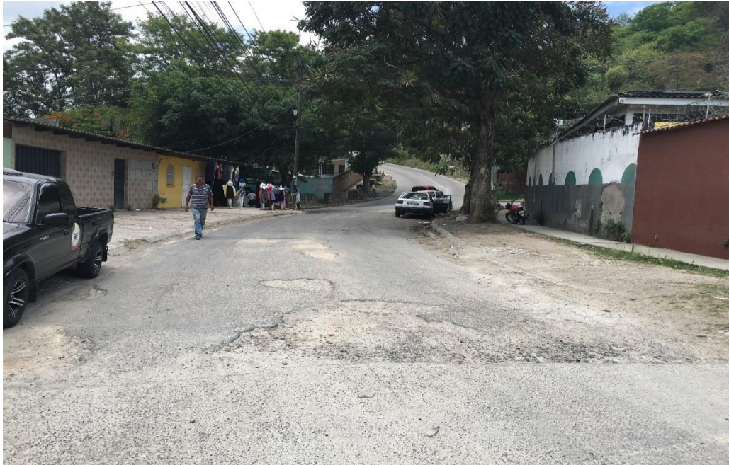
INICIO DEL TRAMO 4

Proyecto: Pavimentación de calle con concreto hidráulico, col. Fé y Vida Código: 1208