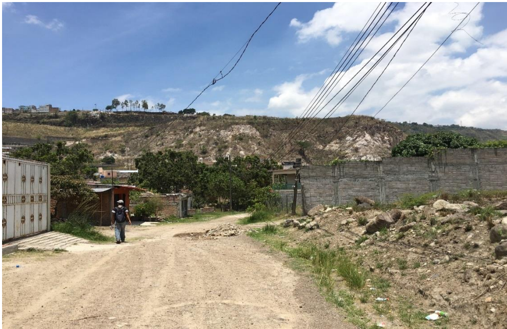
VISTA DEL TRAMO 1