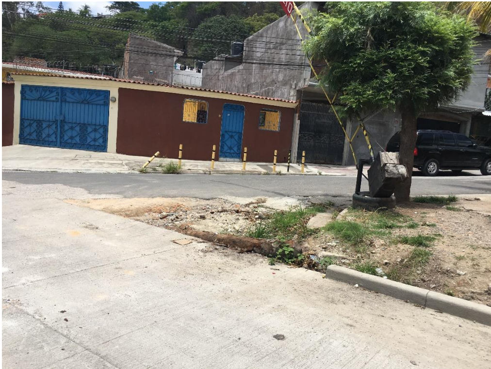
FINAL DE CALLE A PAVIMENTAR DEL TRAMO 4