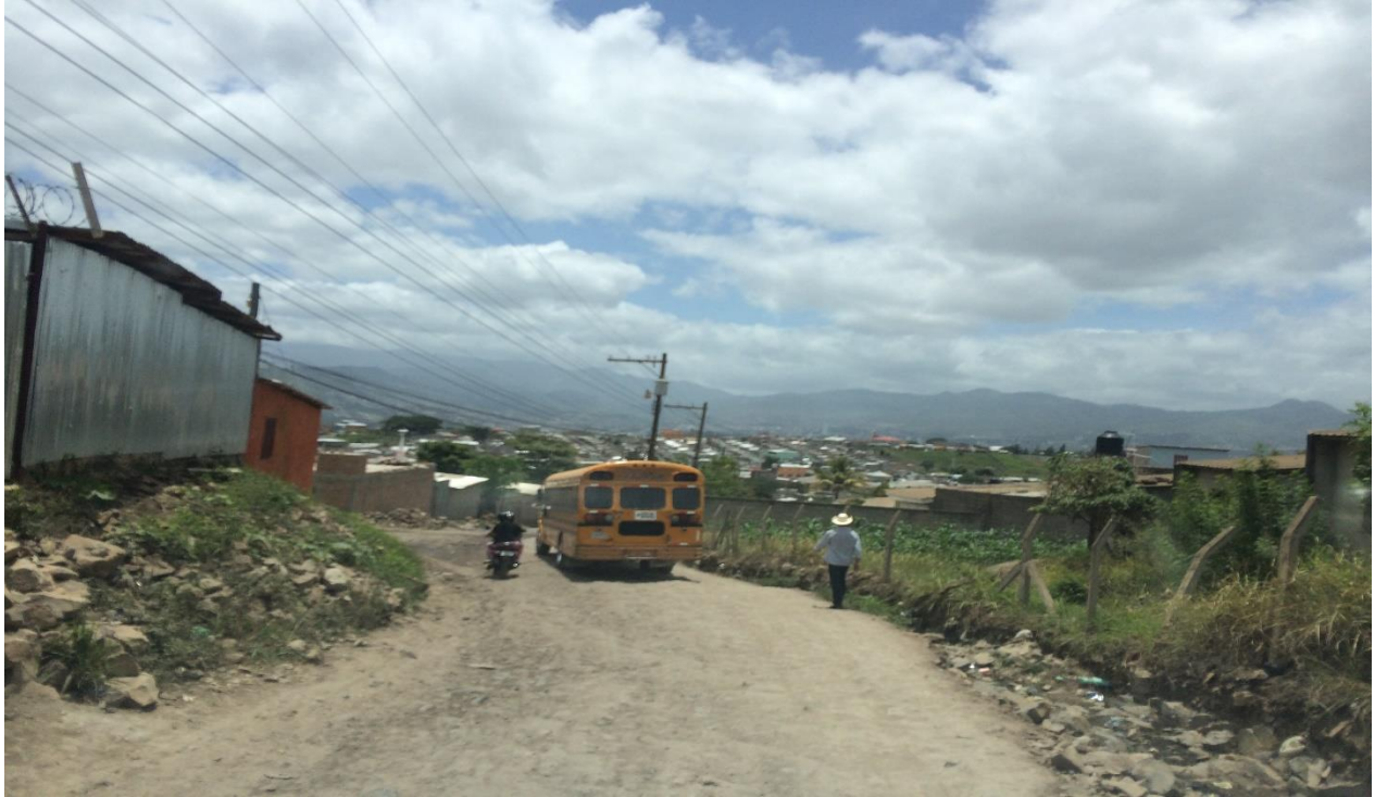
VISTA DEL TRAMO INICIAL A REPARAR, SECTOR DE COL. ARTURO QUEZADA