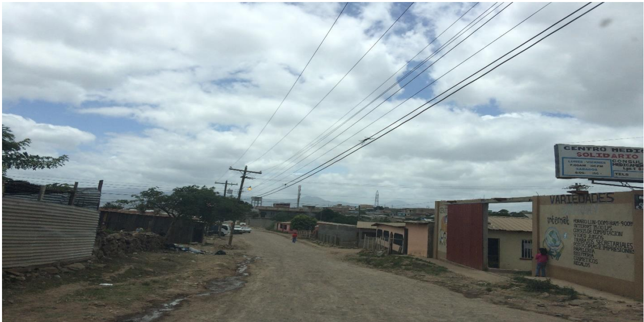
VISTA PANORAMICA DEL TRAMO, COL. NUEVA AUSTRALIA