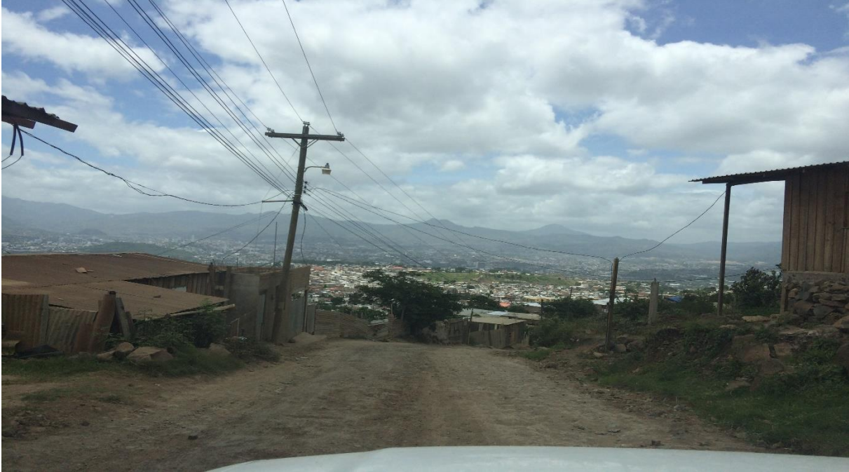
VISTA DEL TRAMO DONDE SE CONSTRUIRAN LAS HUELLAS