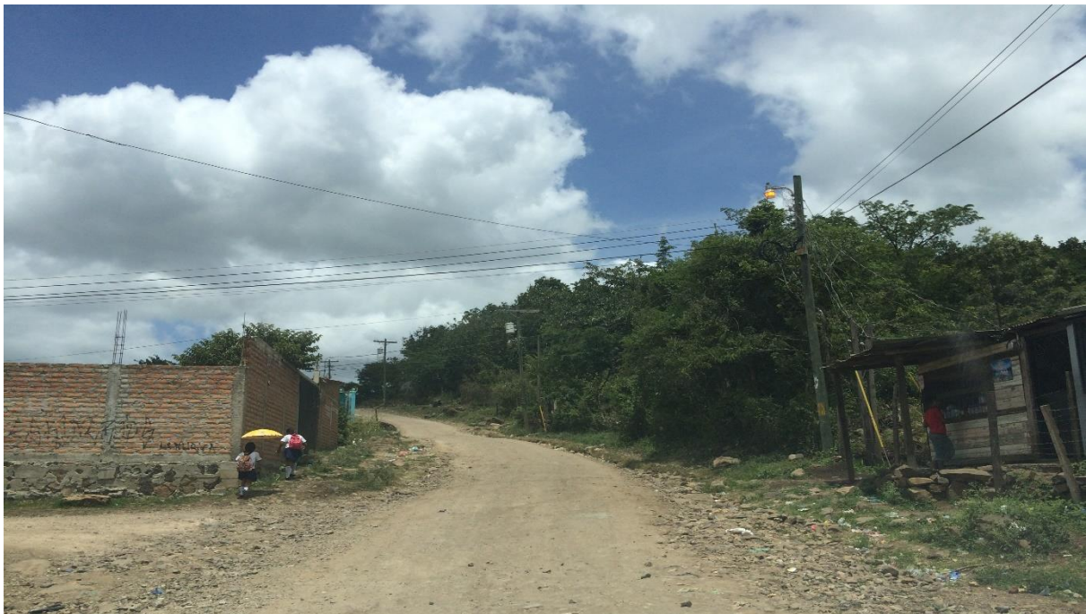
VISTA DEL TRAMO FINAL DE LA REPARACION