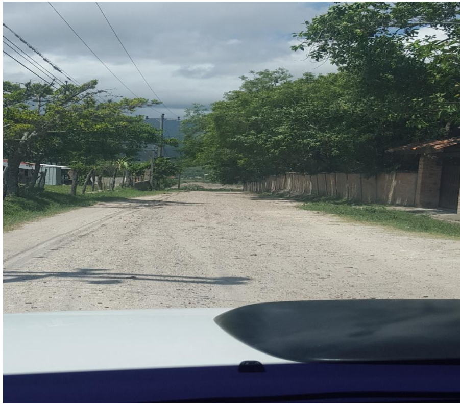
VISTA PANORÁMICA DEL TRAMO A REPARAR