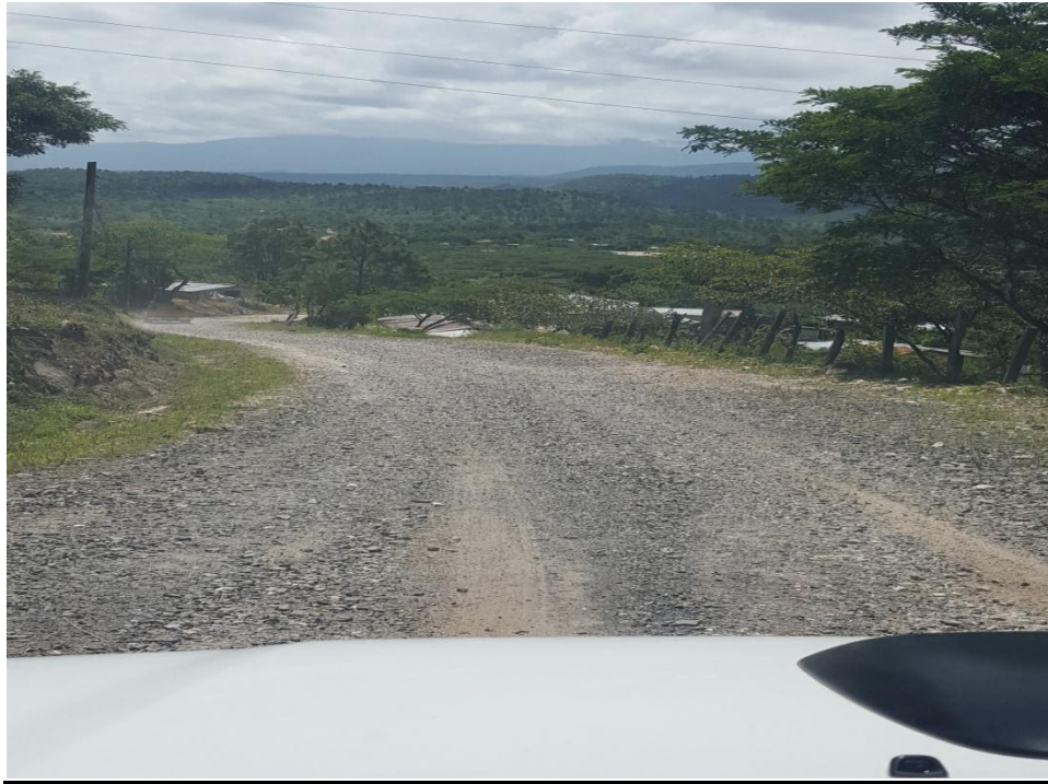
INICIO DEL TRAMO A REPARAR Y CONSTRUIR HUELLAS