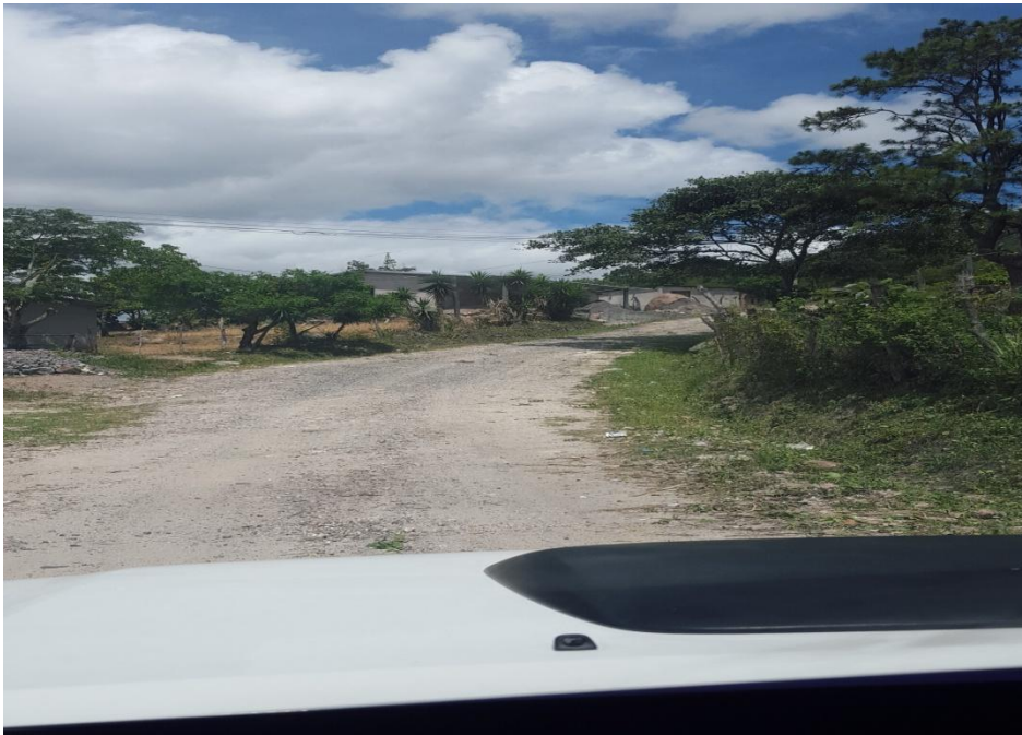
VISTA DEL FINAL DEL TRAMO A REPARAR