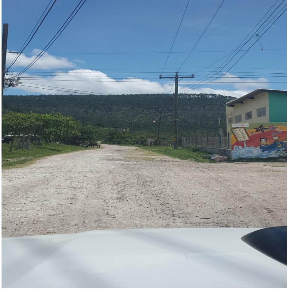
VISTA DEL TRAMO A CONFORMAR