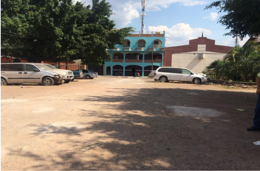
INICIO DE LA CALLE A PAVIMENTAR