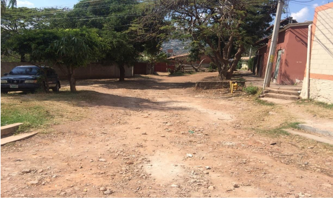
VISTA DE LA CALLE