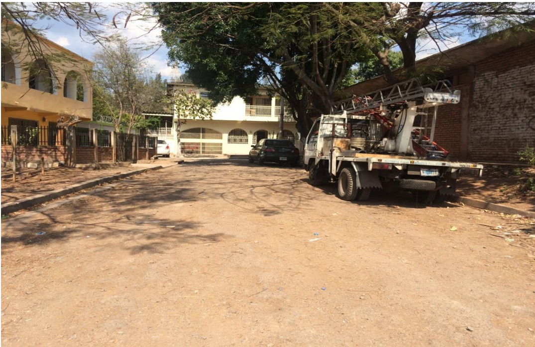
FIN DE LA CALLE A PAVIMENTAR