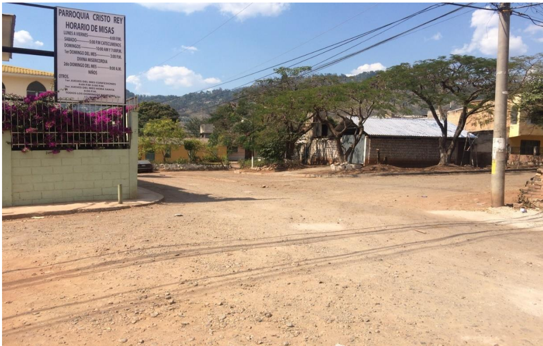
VISTA DE CALLE A PAVIMENTAR