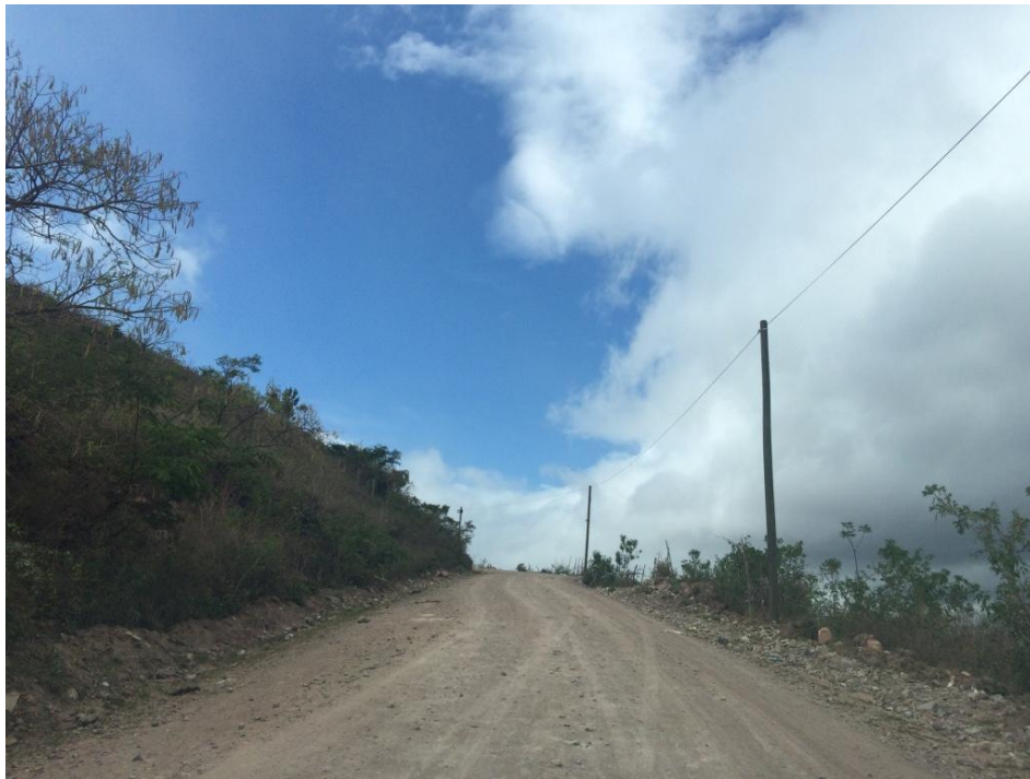
VISTA PANORÁMICA SALIENDO DE COLONIA LA TRAVESÍA