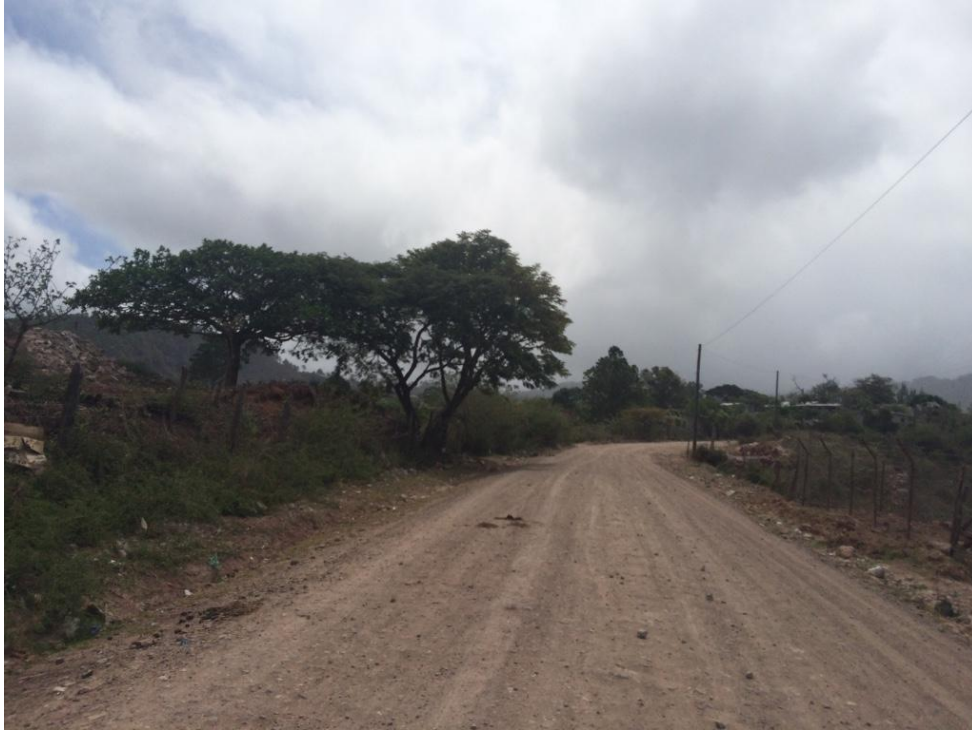
VISTA DEL TRAMO DONDE INICIA ALDEA AGUA BLANCA