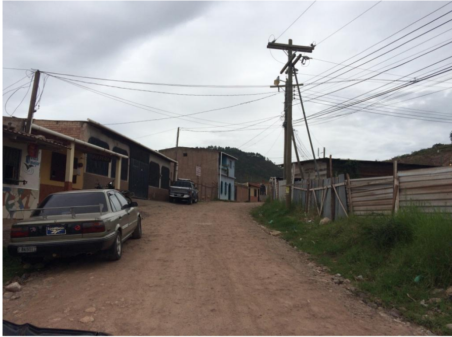
INICIO DEL PROYECTO, EN LAS CERCANÍAS DEL CAMPO SANTO TIERRA SANTA