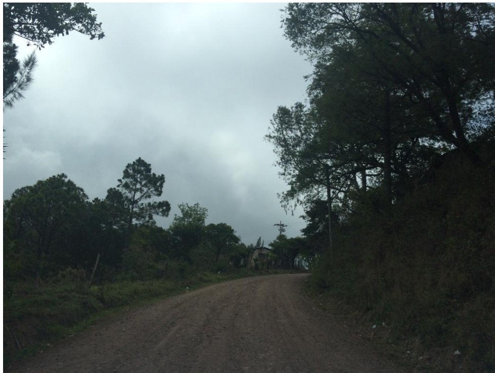
FINAL DEL PROYECTO EN LAS CERCANÍAS DE LA ALDEA LAS TABLAS