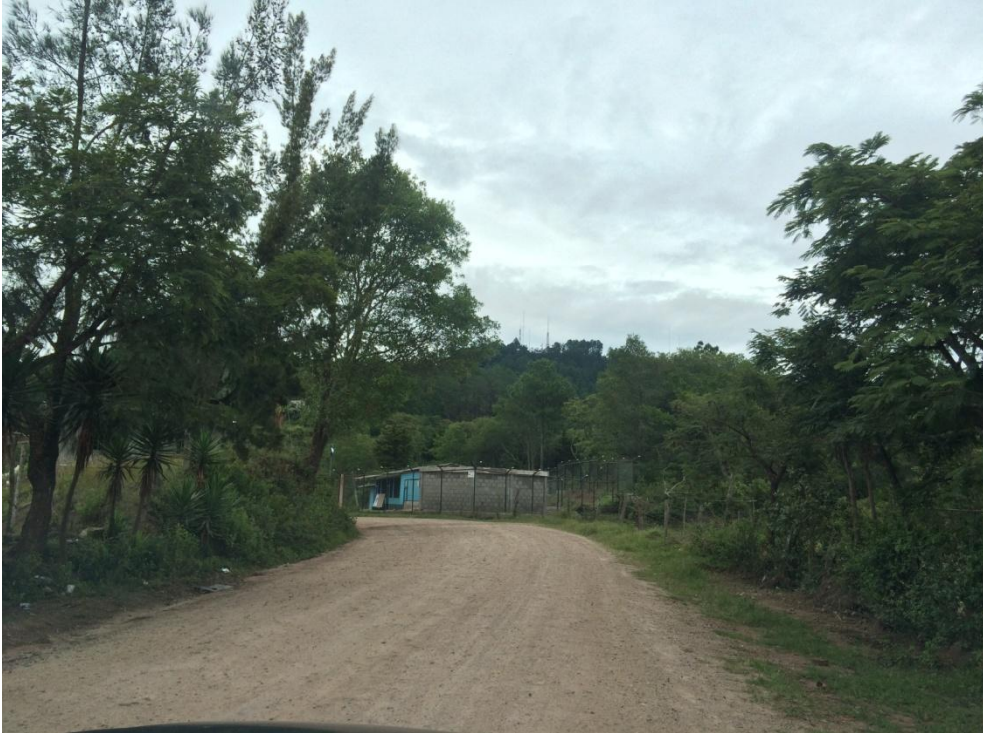
VISTA DE LA ENTRADA A ALDEA LAS TABLAS