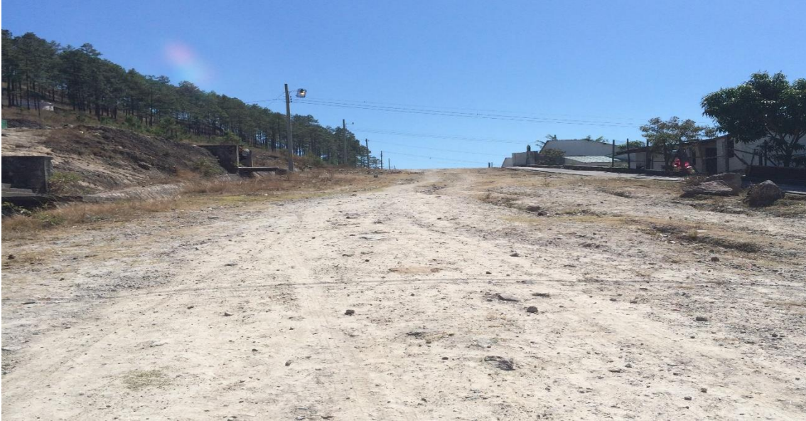
TRAMO EN MAL ESTADO DE LA ZONA