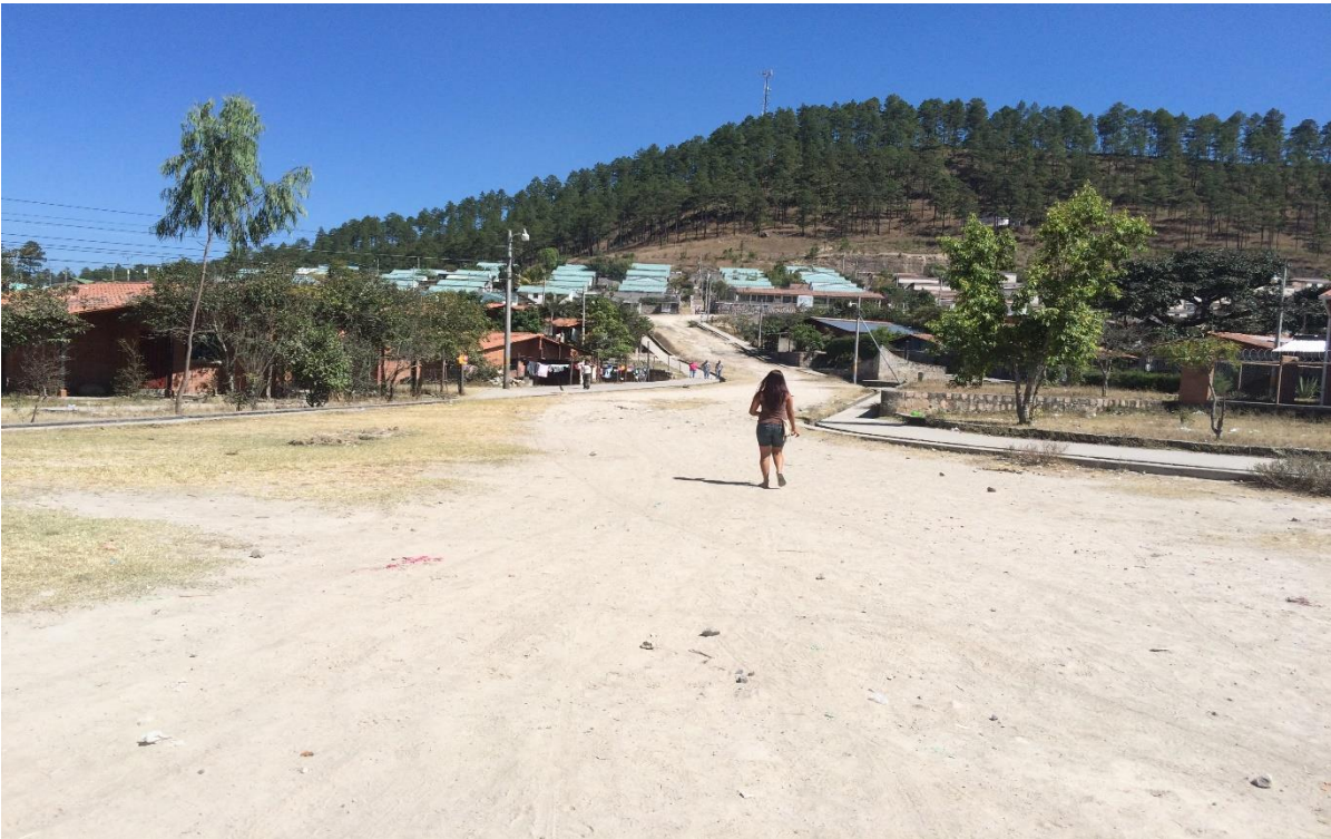
VISTA DE LA CALLE PRINCIPAL DE CIUDAD ESPAÑA