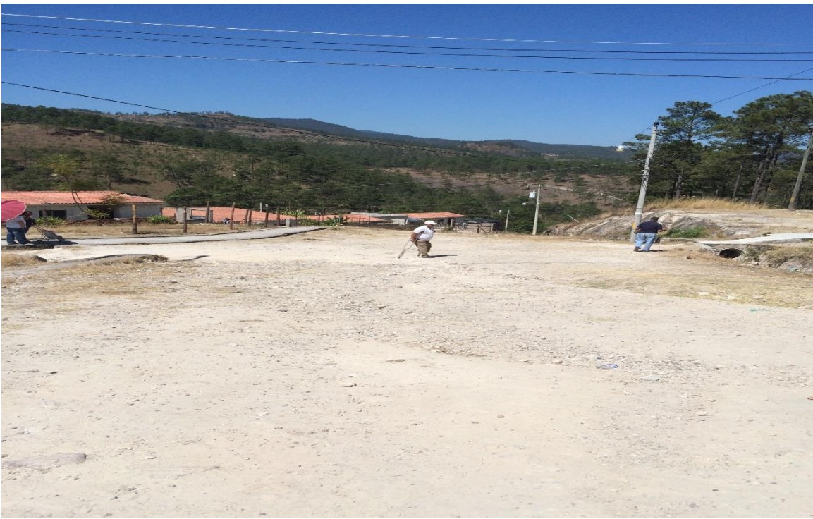
VISTA DEL FINAL DEL TRAMO