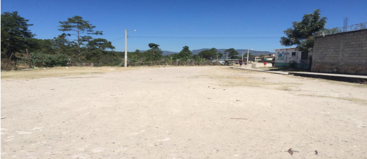
PARTE DEL TRAMO QUE SE REHABILITARA