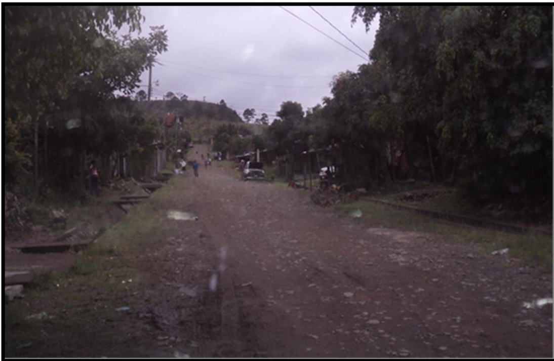
Final de calle en la que se hará el balastado