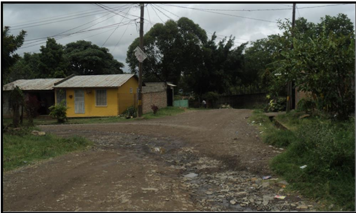
Panorama de calle en la que se hará el balastado