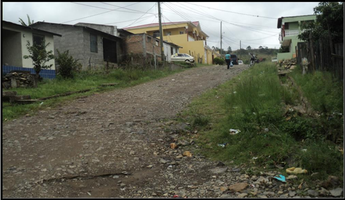
Inicio de calle en la que se hará el balastado