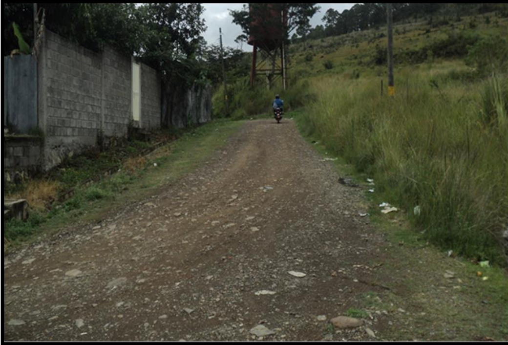
Panorama de calle en mal estado