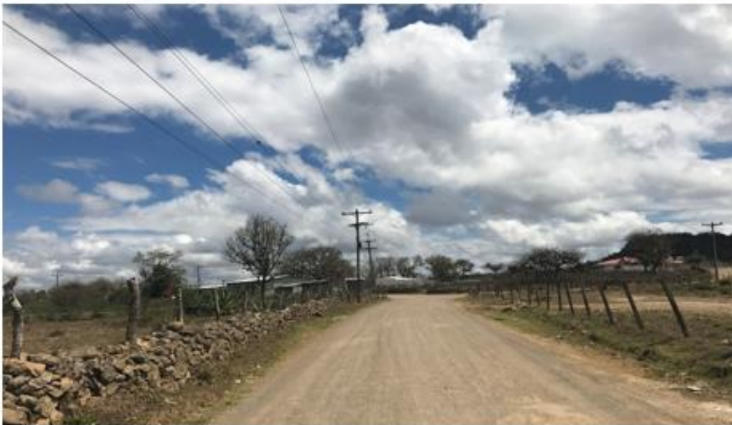
PANORÁMA DE CALLE A REPARAR