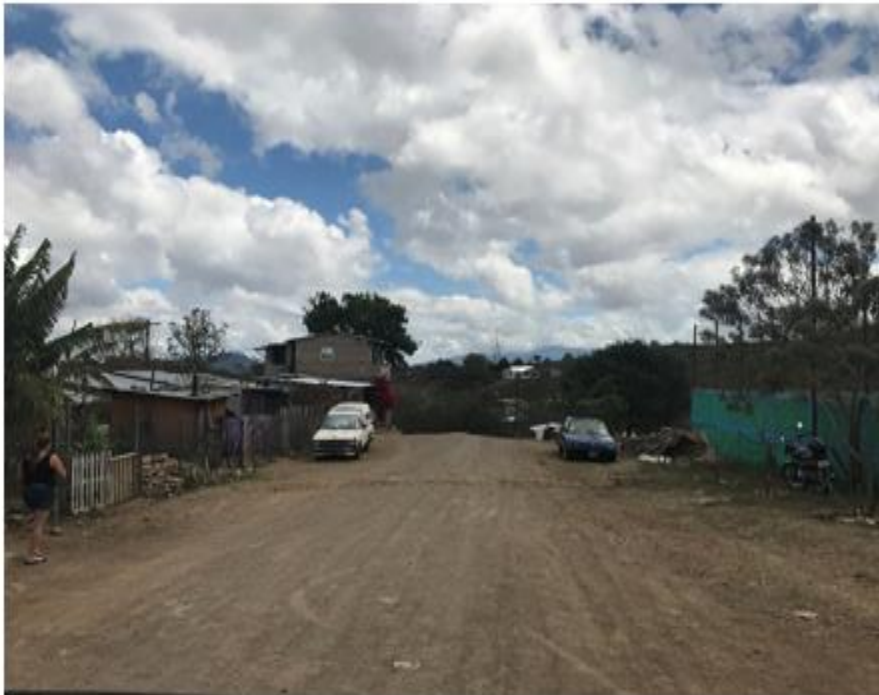
VISTA PANORÁMICA DE LA CALLE DONDE SE CONSTRUIRÁN LAS HUELLAS