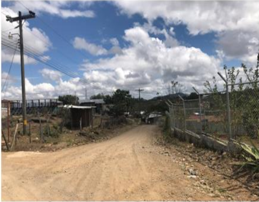
SE OBSERVA EL MAL ESTADO DE LA CALLE

Proyecto: Construcción de huellas vehiculares, col. María José, calle principal Código: 1692