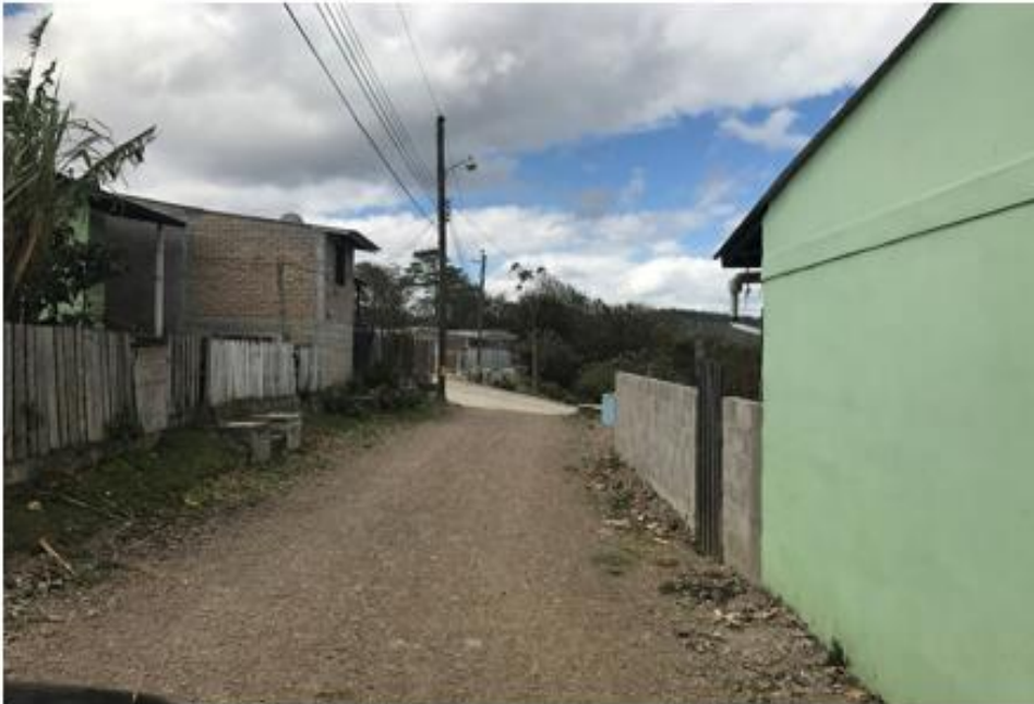
FINAL DE CALLE DONDE SE CONSTRUIRÁN LAS HUELLAS VEHICULARES