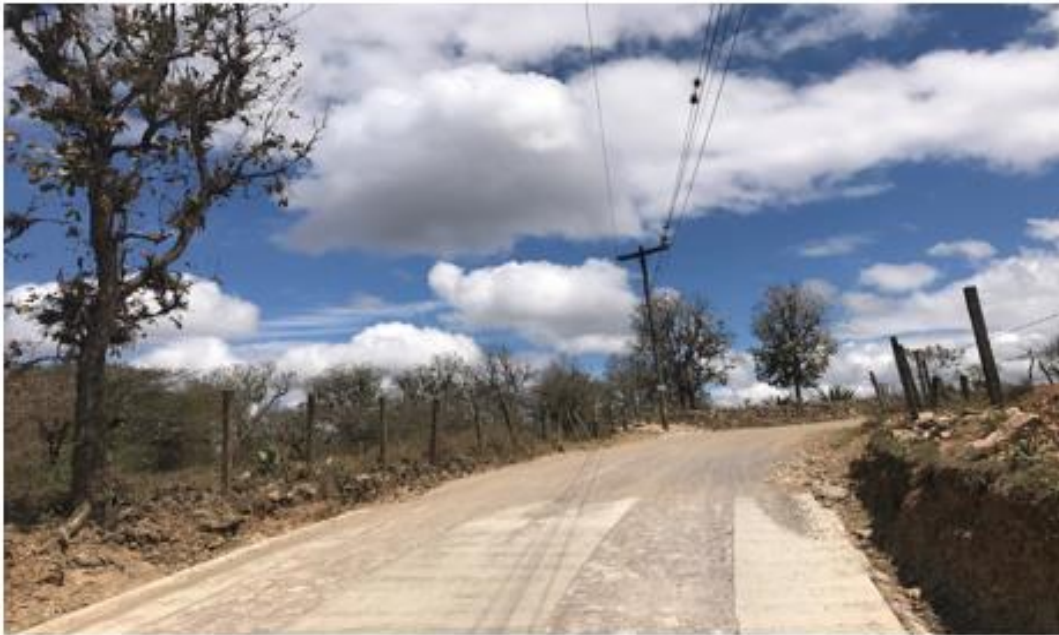
INICIO DE CALLE DONDE SE HARÁN LAS HUELLAS VEHICULARES