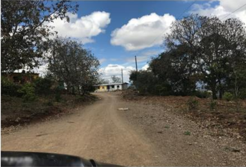
PANORÁMA DEL MAL ESTADO DE LA CALLE

Proyecto: Construcción de huellas vehiculares, col. María José, calle principal Código: 1692