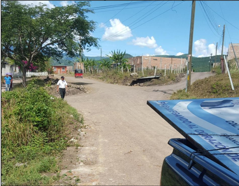
Foto 3. Tramo donde se construirán las cunetas