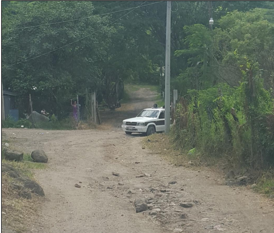
Foto 1. Inicio de proyecto de conformación y balastado

El proyecto en mención esta ubicado en colonia Cataluña y en la colonia Peniel No. 2, accedendo por la carretera a Olancho aproximadamente a la altura del kilometro 8 antes de llegar a PROMDECA, Comayaguela M.D.C.