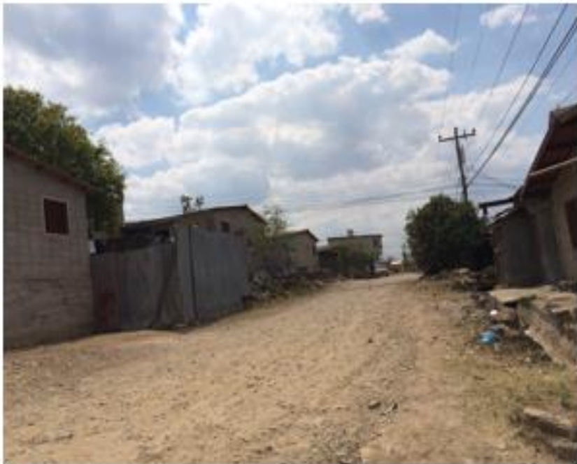
Vista de otro tramo de calle que requiere conformado y balastado.