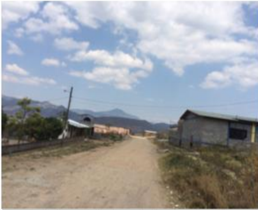
Condiciones actuales de una de las principales calles.