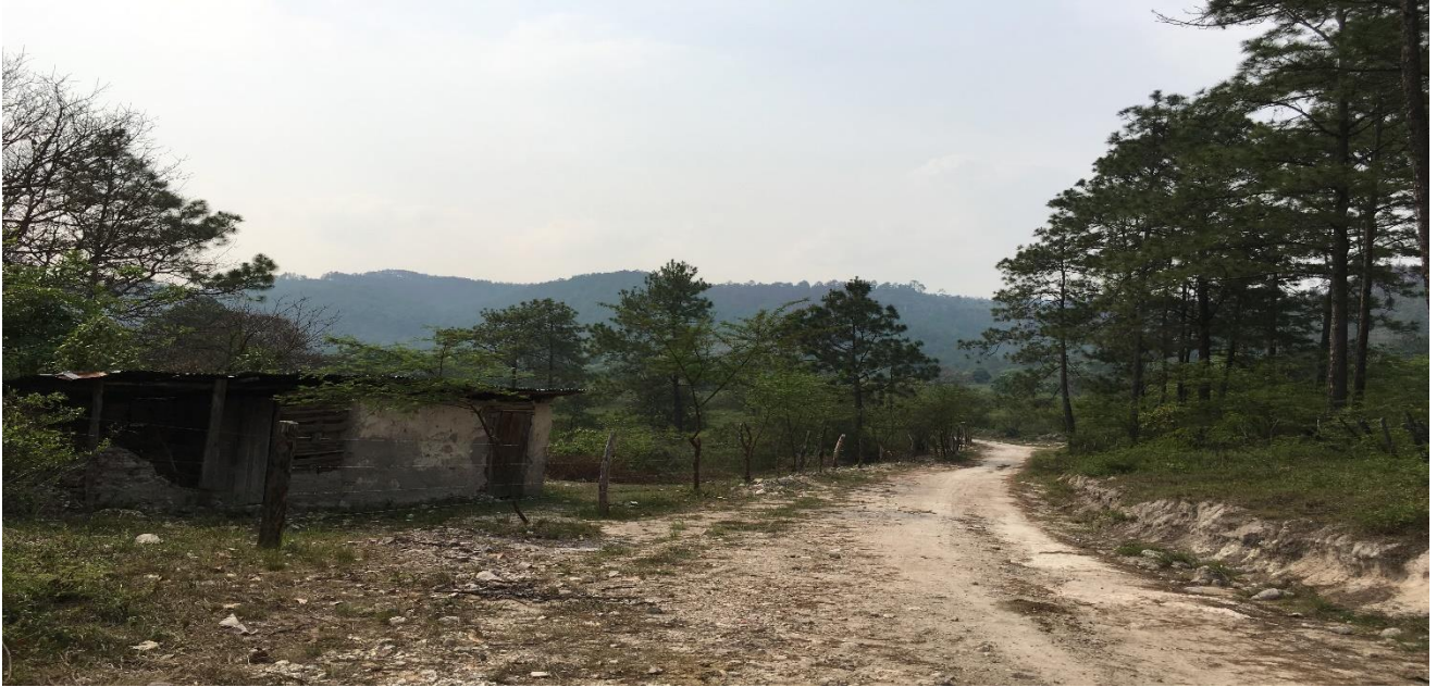
Vista de la calle