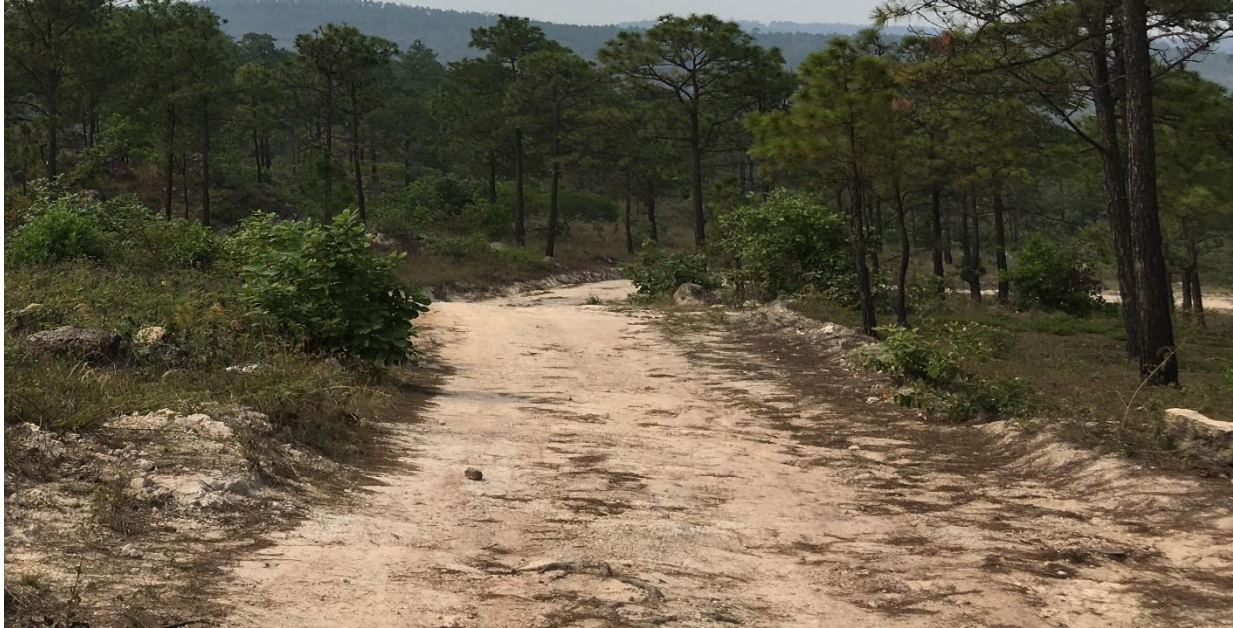
Calle a balastar