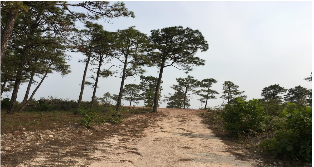
Fin de calle a balastar