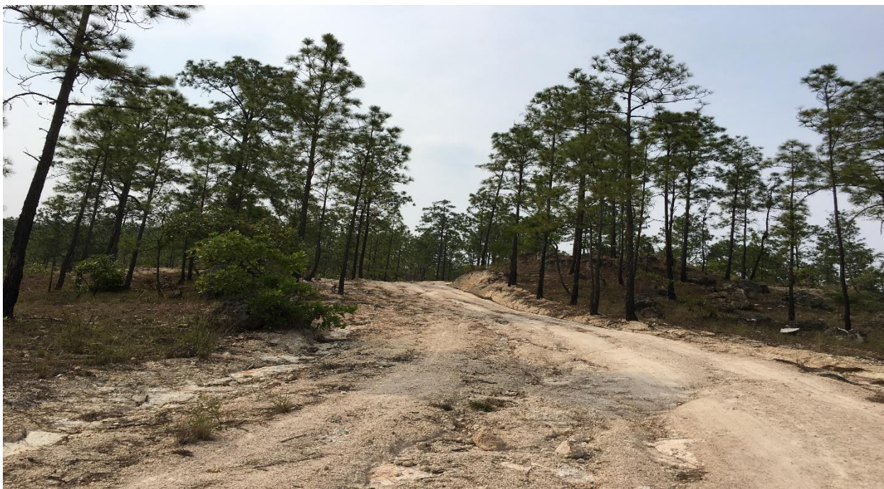
Vista panorámica de la calle