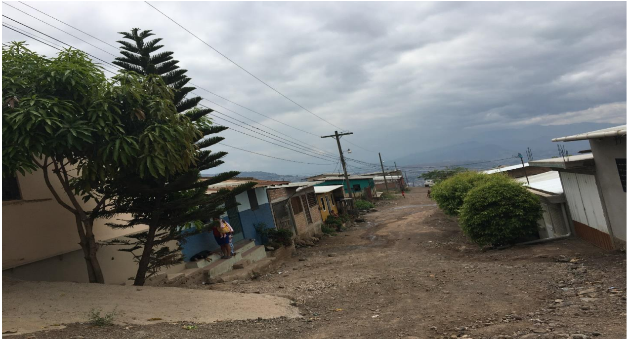
Calle a Balastar