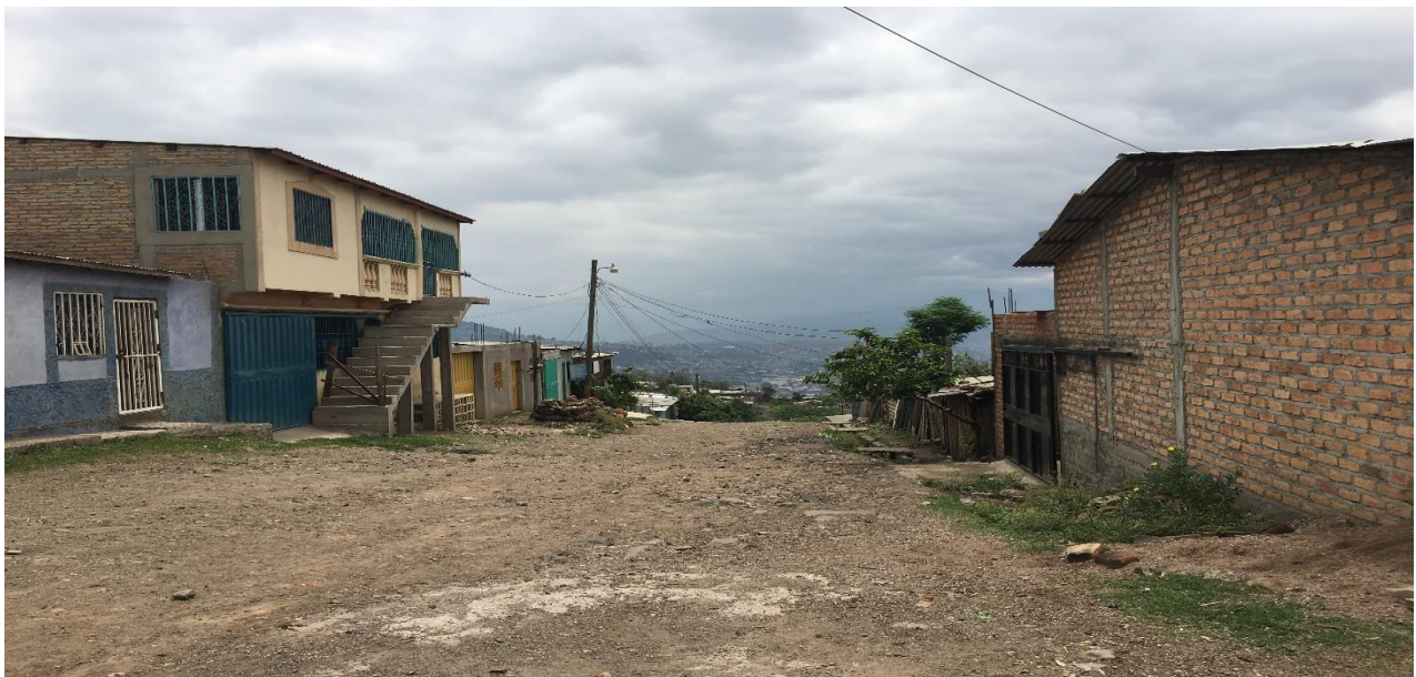
Vista Panorámica de la Calle