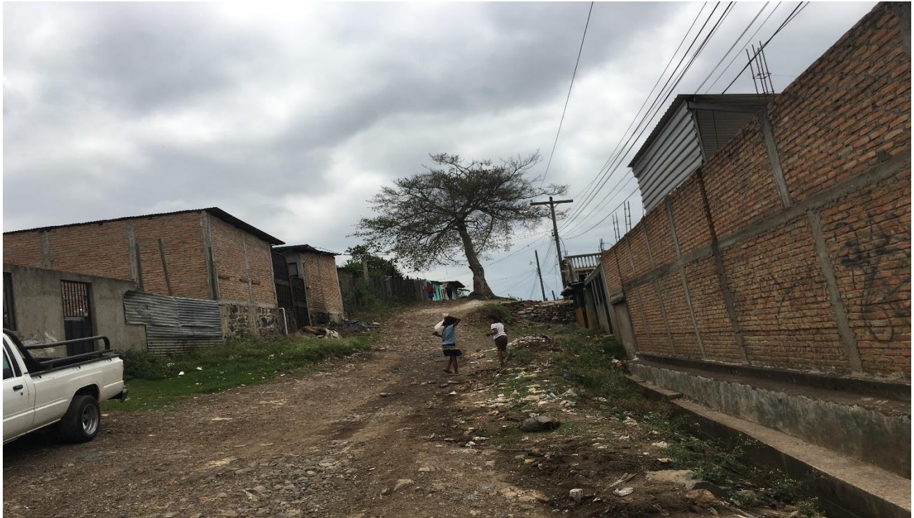
Vista de la Calle