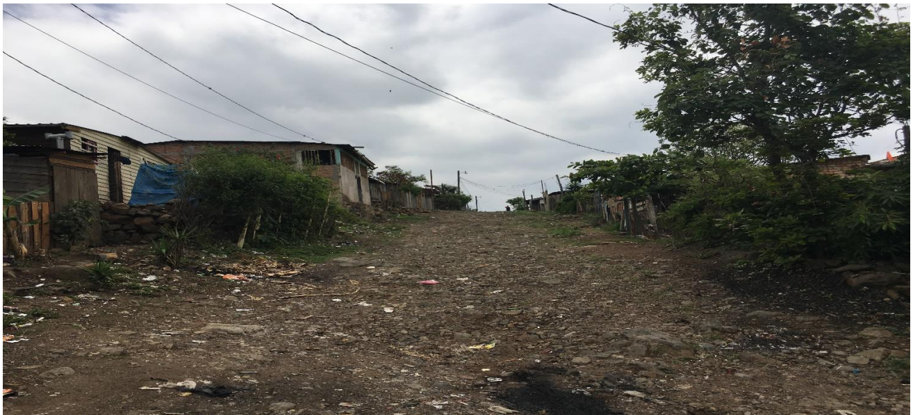
Fin de Calle a Balastar Croquis de Ubicación