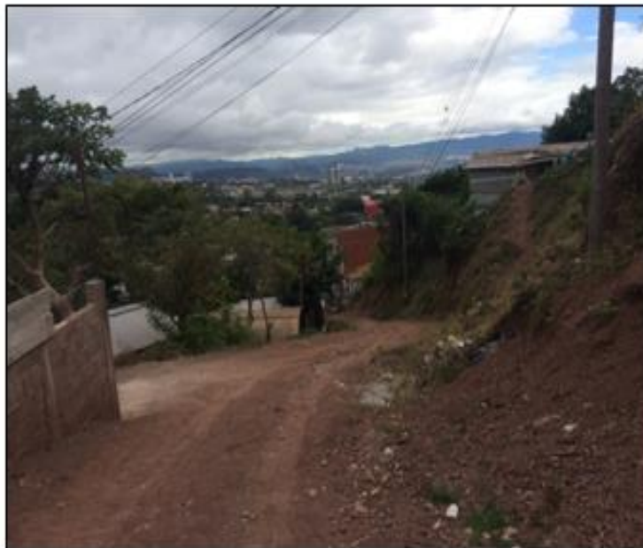
VISTA PANORÁMICA DE CALLE A PAVIMENTAR CON CONCRETO HIDRÁULICO