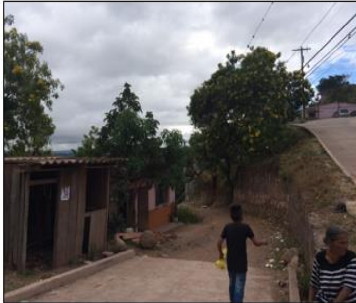
INICIO DE TRAMO A PAVIMENTAR CON CONCRETO HIDRÁULICO

Proyecto: Pavimentación de calle con concreto hidráulico, col. Alpes de Oriente, última calle Código: 1574