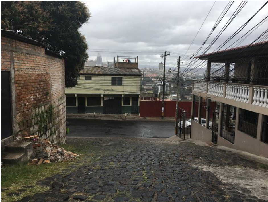
CONDICIONES ACTUALES DEL EMPEDRADO EXISTENTE EN EL SITIO DE APROXIMACIÓN A LA CALLE PRINCIPAL