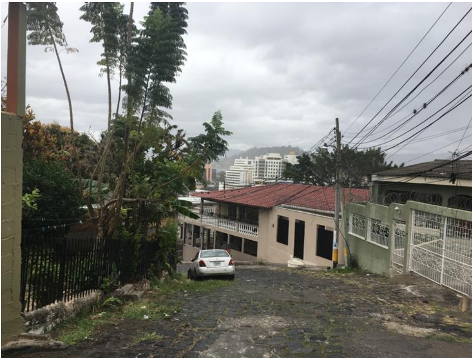
SE PUEDE OBSERVAR EL MAL ESTADO EN QUE SE ENCUENTRA EL EMPEDRADO EXISTENTE