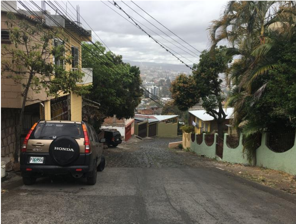
VISTA DE SITIO DONDE EL WHITE TOPPING SE CONECTARÁ AL PAVIMENTO EXISTENTE