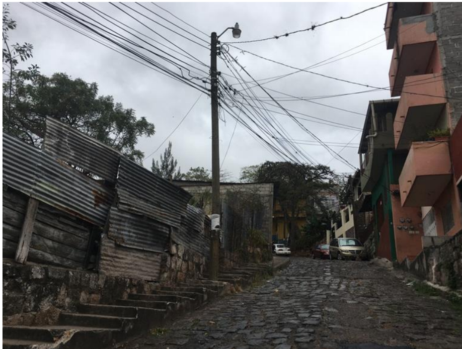
VISTA DE OTRO SECTOR DEL EMPEDRADO A CUBRIR CON WHITE TOPPING