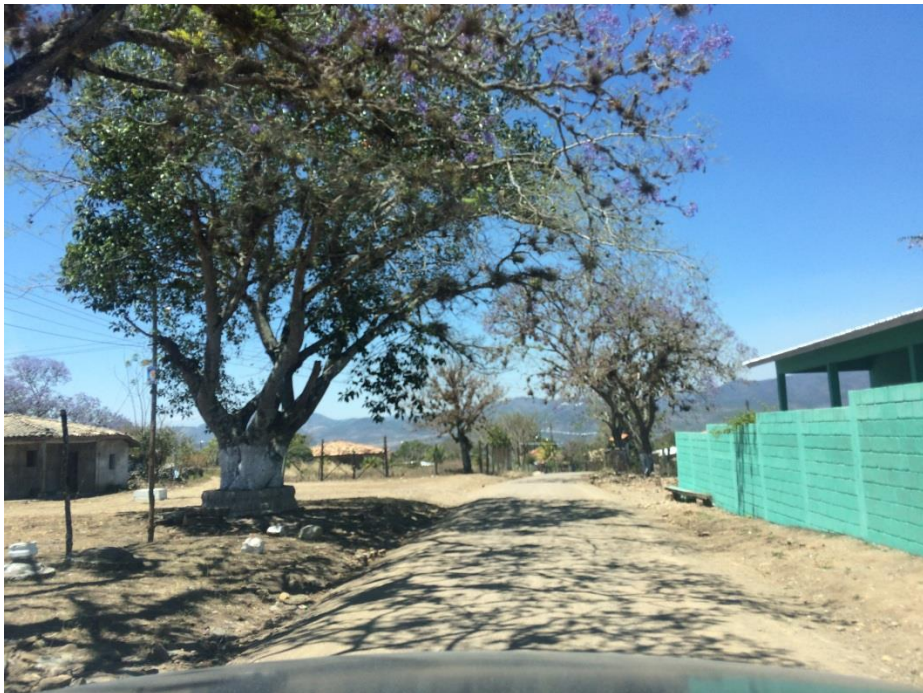
PANORÁMA EN DONDE SE CONFORMARÁ Y BALASTARÁ