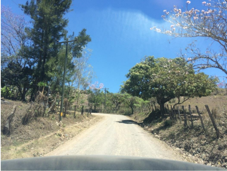
INICIO DE LA OBRA A EJECUTAR