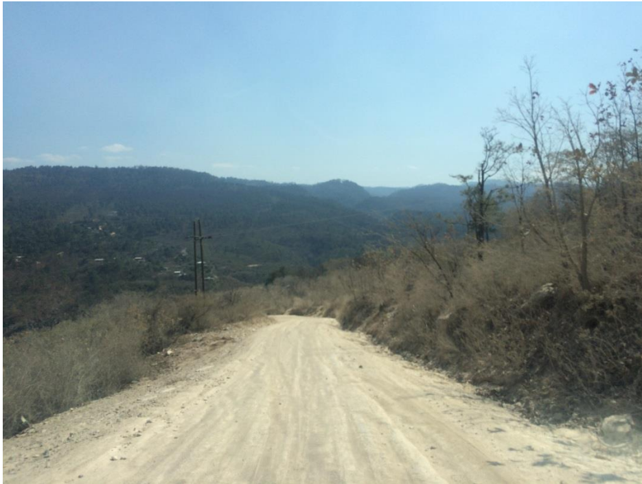
CALLE EN QUE SE EJECUTARÁ LA OBRA