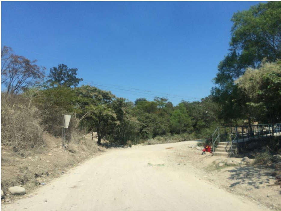
PANORÁMA DE CALLE EN QUE SE EJECUTARÁ LA OBRA