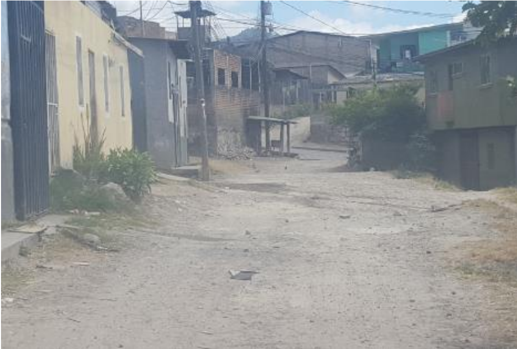
ENTRADA DONDE SE EMPEZARA A PAVIMENTAR CALLE