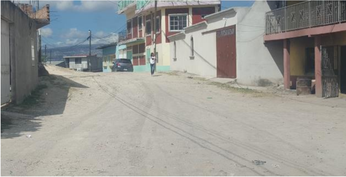
VISTA PANORAMICA DE CALLE A PAVIMENTAR