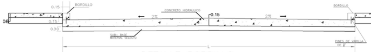
DETALLE BORDILLO DE 15 CM X 15 CM