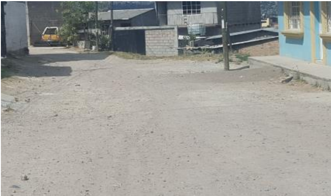
PARTE FINAL DE CALLE A PAVIMENTAR