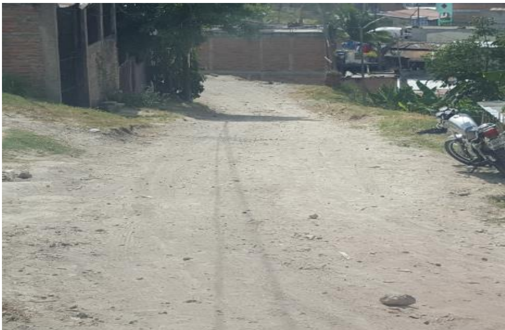
PARTE INTERMEDIA DE CALLE A PAVIMENTAR