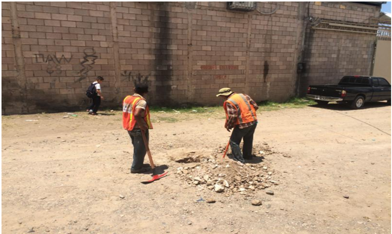
Vista de Personal Haciendo Pruebas del Suelo