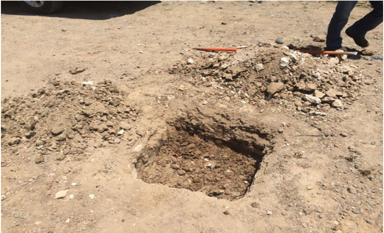
Prueba Calicata Hecha por Personal para ver el estado del Material en el sitio