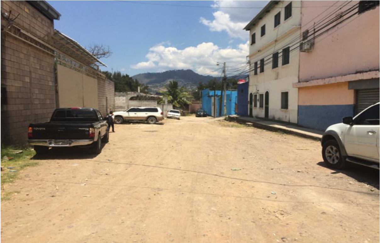
Vista del Final Del Tramo a Pavimentar